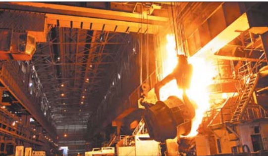
वृद्धि दर्ज की है। ब्यूअर फॉसेस ने अप्रैल से नवंबर 2023 की अर्धवर्ष में 38,93,000 टन हॉट मेसल उत्पादन कर, पिछले वित्तीय वर्ष की इसी अर्धवर्ष में दर्ज 33,86,000 टन उत्पादन को पीछे छोड़ा। इसी क्रम में ककूड स्टील उत्पादन में भी 14 प्रतिशत की वृद्धि दर्ज की है। अप्रैल से नवंबर 2023 की अर्धवर्ष में संयंत्र की स्टील मिलिंग में 36,88,000 टन ककूड स्टील उत्पादन करते हुए, पिछले वित्त वर्ष की इसी

भिलाई, 3 दिसंबर। वर्तमान वित्तीय वर्ष में उत्पादन में निरंतर वृद्धि दर्ज करते हुए सेल-भिलाई इस्पात संयंत्र ने अप्रैल से नवंबर 2023 को अर्धवर्ष यानी वर्ष के प्रथम 8 महीनों में उत्पादन के सभी प्रमुख मापदंडों पर उत्कृष्ट प्रदर्शन किया है। संयंत्र ने वर्तमान वित्त वर्ष की अप्रैल से नवंबर 2023 अर्धवर्ष में औसत पुरिफिंग से लेकर सिंटर उत्पादन, हॉट मेसल, ककूड स्टील और सेलेबल स्टील प्रोडक्शन से लेकर ड्रिस्चिच के लिए लांग व फ्लैट प्रोडक्शन की लोडिंग में पिछले वर्ष की इसी अर्धवर्ष की तुलना में शाहदर वृद्धि दर्ज की है। संयंत्र ने अप्रैल से नवंबर 2023 की अर्धवर्ष में 782 औंस प्रतिदिन औसत पुरिफिंग दर के साथ 16 प्रतिशत की वृद्धि दर्ज की है। कोक ओवन ने पिछले वित्तीय वर्ष की इसी अर्धवर्ष अप्रैल से नवंबर 2022 में 674 औंस की औसत पुरिफिंग दर हासिल की थी। सिंटर उत्पादन में 9 प्रतिशत की वृद्धि दर्ज करते हुए अप्रैल से नवंबर 2023 की अर्धवर्ष में 56,87,000 टन सिंटर का उत्पादन किया। जबकि पिछले वित्तीय वर्ष की इसी अर्धवर्ष में सिंटर उत्पादन 52,27,000 टन दर्ज किया गया था। इसके साथ ही संयंत्र हॉट मेसल उत्पादन में भी 15 प्रतिशत की वृद्धि दर्ज की है। ब्यूअर फॉसेस ने अप्रैल से नवंबर 2023 की अर्धवर्ष में 38,93,000 टन हॉट मेसल उत्पादन कर, पिछले वित्तीय वर्ष की इसी अर्धवर्ष में दर्ज 33,86,000 टन उत्पादन को पीछे छोड़ा। इसी क्रम में ककूड स्टील उत्पादन में भी 14 प्रतिशत की वृद्धि दर्ज की है। अप्रैल से नवंबर 2023 की अर्धवर्ष में संयंत्र की स्टील मिलिंग में 36,88,000 टन ककूड स्टील उत्पादन करते हुए, पिछले वित्त वर्ष की इसी