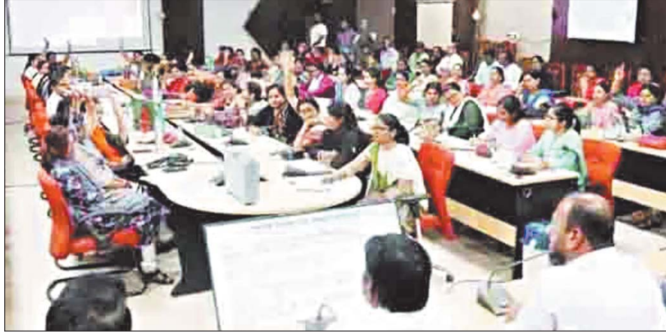
बाकी दलों के साथ ही निर्दलीय प्रत्याशियों के एजेंट भी मतगणना के दौरान मॉडल कॉलेज में रहेंगे।

जगदलपुर 28 नवंबर। बस्तर जिले में विधानसभा चुनाव की मतगणना 3 दिसंबर को होगी निर्वाचन आयोग ने मतगणना से जुड़ी सारी तैयारी लगभग पूरी कर ली है। बस्तर जिले में पहली बार ऐसा होने जा रहा है कि महिला कर्मियों को मतगणना की जिम्मेदारी सौंपी जा रहा है, उनकी ट्रेनिंग भी पूरी हो गई है। बस्तर जिले के तीन विधानसभा जगदलपुर, चित्रकोट एवं बस्तर की गणना 16 से 18 राउंड में की जाएगी। इस दौरान ईवीएम की मतगणना के लिए 14 टेबल लगाए जाएंगे और प्रत्येक टेबल पर भाजपा-कांग्रेस के 14-14 एजेंट मौजूद रहेंगे। जगदलपुर विधानसभा के 1770 डाक मतपत्र के लिए 4 अतिरिक्त एजेंट नियुक्ति किए जा रहे हैं। दोनों प्रमुख राजनैतिक दलों की तरफ लगभग 40 एजेंट मतगणना के दौरान मतगणना स्थल मॉडल कॉलेज में मौजूद रहेंगे।