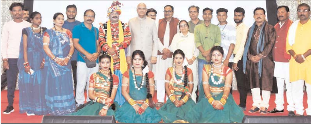
रायपुर, 28 नवंबर ■ तरुण छत्तीसगढ़

मुंबई के राजभवन में छत्तीसगढ़ी, मध्य प्रदेश एवं आंध्र प्रदेश के कलाकारों को आमंत्रित किया गया छत्तीसगढ़ी राज्य स्थापना दिवस के अवसर पर एक भारत श्रेष्ठ भारत के माध्यम से दक्षिण मध्य क्षेत्र सांस्कृतिक केंद्र द्वारा राजभवन में कार्यक्रम का आयोजन हुआ कार्यक्रम के मुख्य अतिथि राज्यपाल रमेश बैस जी रहे। इस अवसर पर छत्तीसगढ़ी की