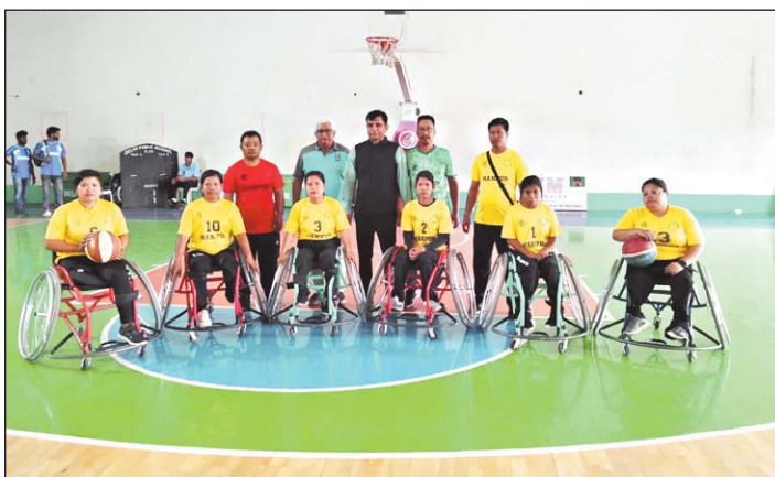
किया। यह प्रतियोगिता 23 से 29 नवंबर तक स्थानीय दिग्विजय स्टेडियम में आयोजित की जा रही है। उक्ताशय की जानकारी देते हुए छत्तीसगढ़

आज प्रातः काल खेले गये एक और मैच में कर्नाटक ने ओडिशा की टीम को 24-05 से परास्त