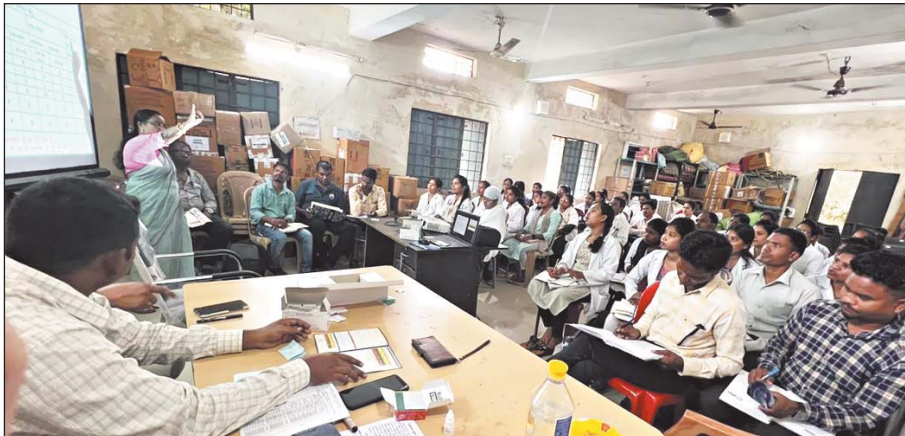
जिला स्तर पर भी प्रशिक्षित किया गया है। यह सर्वे दल जिले के सभी ग्राम स्तर के प्रत्येक घर घर जाकर मलेरिया टेस्ट करेगी। वहीं मलेरिया पॉजिटिव व्यक्तियों को मौके पर दवाएं भी उपलब्ध कराई जाएगी। ज्ञात हो कि इस अभियान के तहत जिला सुकमा में मलेरिया मरीजों की धनात्मक प्रकरणों में 47 फीसदी से घटकर 7 फीसदी हुई है।

सुकमा 24 नवंबर। मलेरिया मुक्त छत्तीसगढ़ अभियान नौवां चरण के तहत जिले को मलेरिया मुक्त बनाने के लिए 28 नवंबर से 18 दिसंबर 2023 तक अभियान का संचालन किया जाएगा। इस दौरान सुकमा जिले के समस्त ग्रामीण एवं सुदूर अंचल क्षेत्रों में लोगों का शत प्रतिशत मलेरिया जांच एवं तत्काल उपचार के साथ ही मलेरिया के प्रति जागरूक किया जाएगा। जिले मलेरिया मुक्त छत्तीसगढ़ अभियान के तहत स्वास्थ्य विभाग द्वारा 325 सर्वे दल का गठन किया गया है। सर्वे दल के द्वारा 2 लाख 83 जहर 245 व्यक्तियों का मलेरिया जांच किया जायेगा। साथ ही इस दल को ग्राम, विकासखण्ड स्तर और