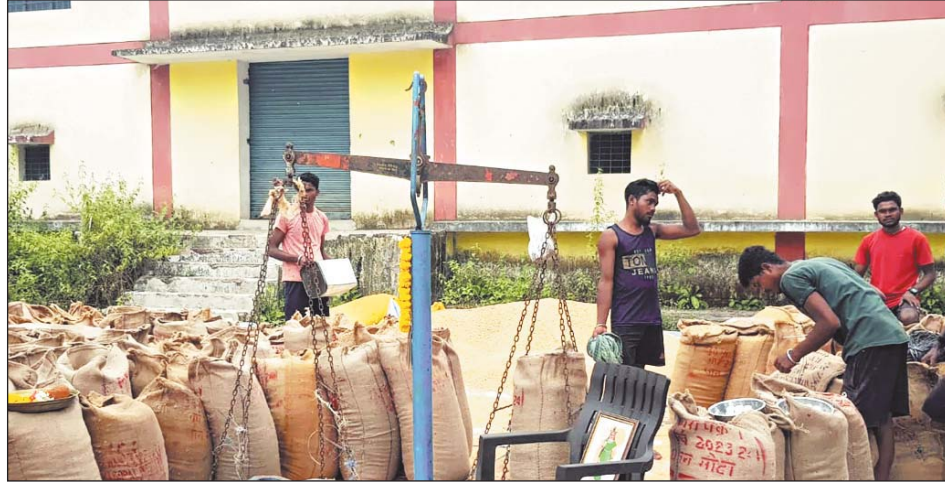
की दरों, पंजीकृत किसानों की संख्या, फड की व्यवस्था का जायजा लिया और धान खरीदी के लिए समितियों

कलेक्टर ने किया धान खरीदी केंद्र का निरीक्षण, लिया व्यवस्था का जायजा- कलेक्टर श्री हरिस. एस ने सुकमा स्थित धान खरीदी केंद्र का निरीक्षण किया और खरीदी व्यवस्था का जायजा लिया। उन्होंने खरीदी केंद्र में किए गए आवश्यक व्यवस्थाओं, धान खरीदी