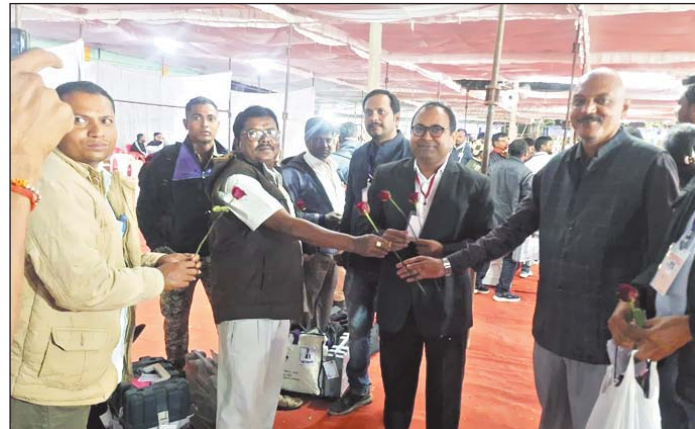
अधिकारियों ने भी गुलाब फूल देकर स्वागत किया। माकूल व्यवस्था की गई थी।

महासमुद्र 19 नवंबर। महासमुद्र जिले में 17 नवंबर को हुए मतदान के पश्चात मतदान दलों की वापसी के दौरान पहला दल राज 9 बजे खखरी विधानसभा अंतर्गत मतदान केन्द्र धरमपुर, छिंदौला, अमेठी सहित अन्य मतदान दल की सकुशल वापसी हुई। जिला प्रशासन द्वारा सफलतापूर्वक मतदान संपन्न कराने के लिए गुलाब फूल देकर मतदान दल का स्वागत किया गया। कलेक्टर श्री प्रभात मलिक ने सफलता पूर्वक निर्वाचन संपन्न कराने के लिए पूरी टीम को बधाई दी एवं गुलाब भेंट कर उनका स्वागत किया। जिला पंचायत सीईओ श्री एस. आलोक, उपजिला निर्वाचन अधिकारी श्री निर्भय साहू, खखरी के आर ओ सृष्टि चंद्राकर एवं निर्वाचन से जुड़े