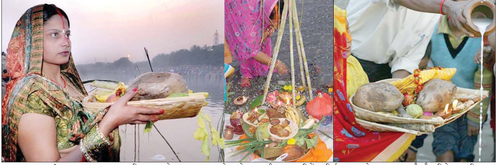
■ तरुण छत्तीसगढ़ संवाददाता

दत्तेवाड़ा 19 नवंबर। देश भर में सूर्य उपासना का पर्व छठ कार्तिक शुक्ल की षष्ठी तिथि को बड़े ही श्रद्धा एवं भक्तिभाव के साथ मनाया जा रहा है। सूर्योपासना का यह अनुपम लोकपर्व मुख्य रूप से पूर्वी भारत के बिहार, झारखण्ड, पूर्वी उत्तर प्रदेश में मनाया जाता है। छठ पर्व वर्ष में दो बार चैत्र एवं कार्तिक मास में मनाया जाता है। चैत्र माह में मनाये जाने वाले छठ को चैती छठवा तथा कार्तिक माह में मनाए जाने वाले छठ पर्व को कार्तिक छठ के नाम से जाना जाता है। पारिवारिक सुख समृद्धि तथा मनोवांछित फल प्राप्ति के लिए मनाये जाने वाले सूर्योपासना के इस पर्व के प्रति लोगों की आस्था देश में लगातार बढ़ती ही जा रही है। इस पर्व की सबसे बड़ी विशेषता यह है कि सदियों से गंगा नदी व अन्य सरोवरों में कतारबद्ध खड़े होकर सभी जाति व धर्मों के लोग अपने आराध्य देव सूर्य भगवान की आराधना करते हैं। यह पर्व बड़ा फलदायी होता है। इसे स्त्री व पुरुष दोनों समान रूप से मनाते हैं। इस पर्व के बारे में मान्यता यह भी है कि जिस स्त्री पुत्र ने इस पर्व को पूरी आस्था, भावना एवं धार्मिक रिति रिवाज के साथ किया उन्हें भगवान सूर्य ने शीघ्र ही मनवांछित फल प्रदान किया है। छठ व्रत मनाये जाने के पीछे वेद पुराणों में अनगिनत कहानियाँ प्रचलित हैं।