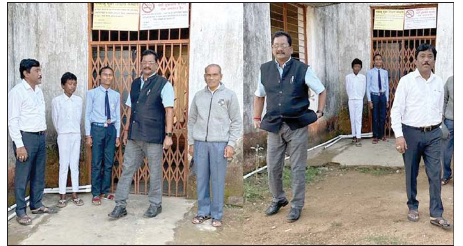
■ तरुण छत्तीसगढ़ संवाददाता