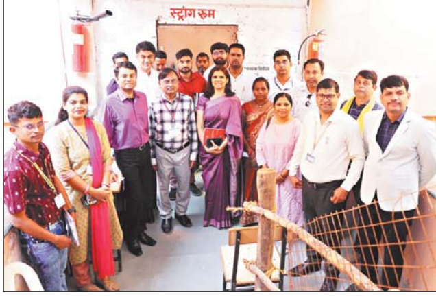
तरुण छत्तीसगढ़ संवाददाता

मतदान पश्चात देर रात तक चलता रहा मशीनों को जमा करने का सिलसिला, 3 दिसम्बर को होगी मतगणना