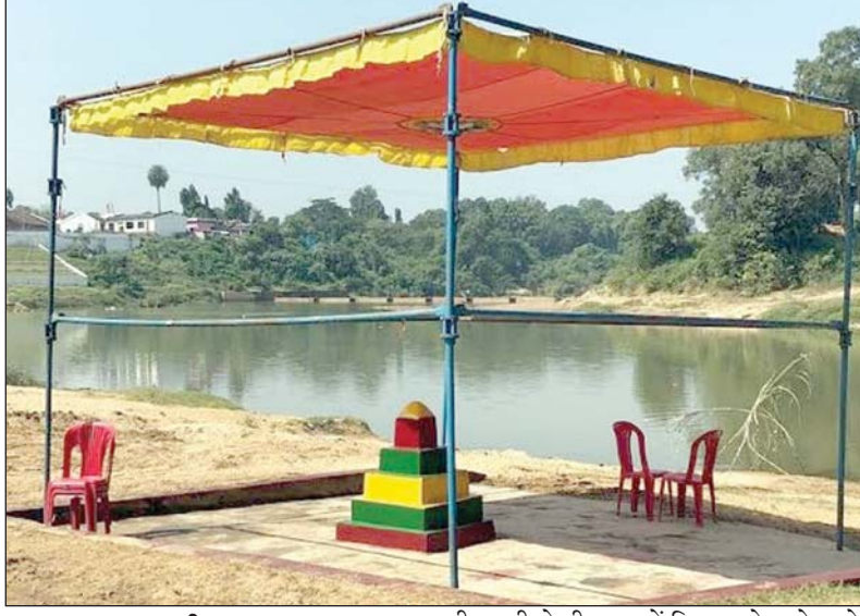
■ तरुण छत्तीसगढ़ संवाददाता

छठ पर्व पूरे भक्ति भाव के साथ मनाया जा रहा, छठ घाट की भव्य सजावट की गई