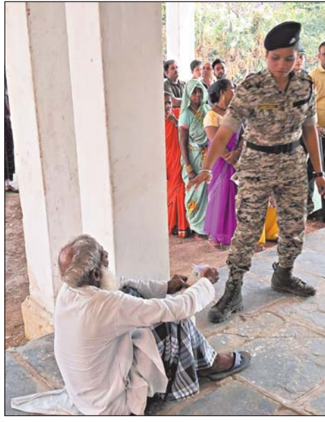
एक बुजुर्ग मतदाता वोट डालने घिसटकर मतदान केन्द्र पहुंचा।