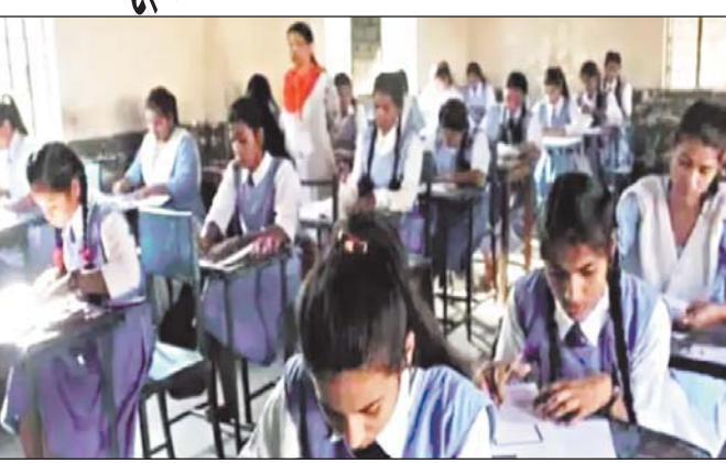
जाएंगी। कई स्कूल छमाही परीक्षाओं के बाद अतिरिक्त कक्षाएं लगाने की भी तैयारी में हैं, ताकि वार्षिक परीक्षाओं के पर्याप्त समय पहले कोर्स पूर्ण किया जा सके और छात्रों को रवीजन के लिए भी वक्त मिले। बोर्ड कक्षाओं की प्रायोगिक परीक्षा जनवरी माह में प्रारंभ होने की संभावना है। वहीं सैद्धांतिक परीक्षाएं मार्च के प्रथम सप्ताह से शुरू होगी।

रायपुर, 17 नवंबर। चुनाव कार्य में शिक्षकों की ड्यूटी लगाए जाने का असर पढ़ाई पर भी दिखने लगा है। हालात यह है कि दिसंबर में होने वाली छमाही परीक्षा में इस बार 80% की जगह 70% पाठ्यक्रम से ही सवाल आएंगे। दिसंबर से प्रथम सप्ताह से स्कूलों में छमाही परीक्षाएं शुरू होगी। इसके लिए समय-सारिणी जिला शिक्षा कार्यालय द्वारा जारी कर दी गई है। वस्तुस्थिति पता करने के लिए विभिन्न शासकीय विद्यालयों के प्राचार्यों, शिक्षकों व छात्रों से बात की तो यह ज्ञात हुआ कि निर्धारित पाठ्यक्रम अब तक पूर्ण नहीं हो सका है। इन स्थितियों में जितना पाठ्यक्रम पूर्ण हो सका है, उतने में ही परीक्षाएं ली