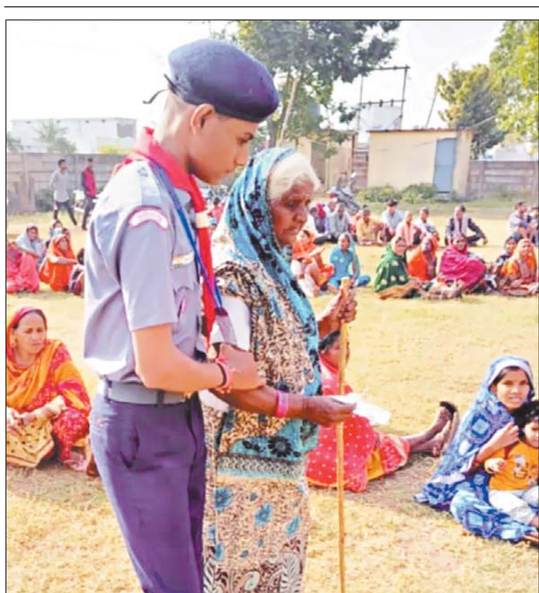
रायपुर 17 नवंबर। स्काउट एवं गाइड के कार्यकर्ताओं ने आज बुजुर्ग व दिव्यांग मतदाताओं को मतदान केन्द्र तक ले जाने में मदद की।