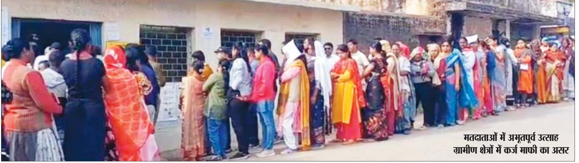
मतदाताओं में अभूतपूर्व उत्साह ग्रामीण क्षेत्रों में कर्ज माफी का असर