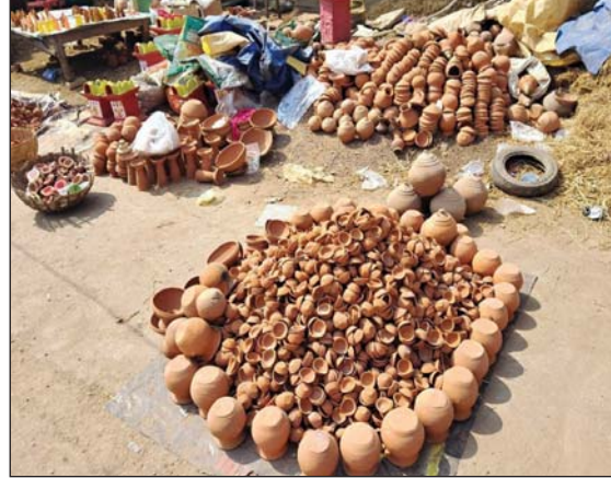
रायपुर, 9 नवम्बर। दीपावली पर्व के लिए बाजार में दीयों और मिट्टी से निर्मित मां लक्ष्मी की मूर्तियों की जमकर बिक्री हो रही है।