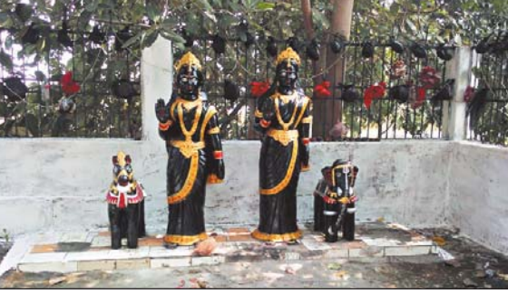
नवंबर को मड़ई मेला का कार्यक्रम आयोजित किया गया है जिसमें राशि कालीन मनोरंजन के लिए छत्तीसगढ़ी नाचा जय छत्तीसगढ़ महतारी नाचा पार्टी मंदलौर चरण का कार्यक्रम रखा गया है।

अंवरी 9 नवंबर। प्रतिवर्ष की भांति इस वर्ष भी ग्राम पुरेना में स्थित मां अंगार मोती के दरबार में दीपावली त्यौहार के बाद आने वाले पहले शुक्रवार को मड़ई मेला का कार्यक्रम होता था लेकिन इस वर्ष त्यौहार का पहले शुक्रवार 17 नवंबर को ही रहा है वहीं छत्तीसगढ़ में विधानसभा चुनाव का दूसरा चरण 17 नवंबर को होने वाला है जिसे देखते हुए समस्त ग्रामवासी के सहयोग से 17 नवंबर को स्थगित कर दूसरे शुक्रवार 24