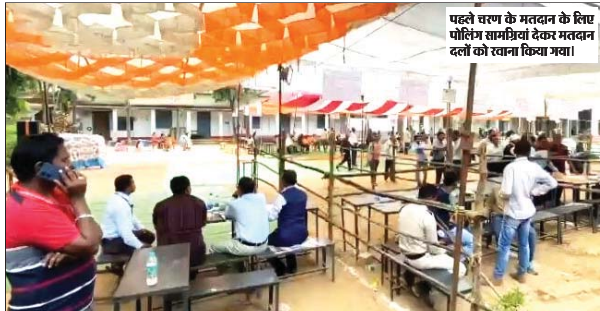
पहले चरण के मतदान के लिए पोलिंग सामग्रियां देकर मतदान दलों को रवाना किया गया।