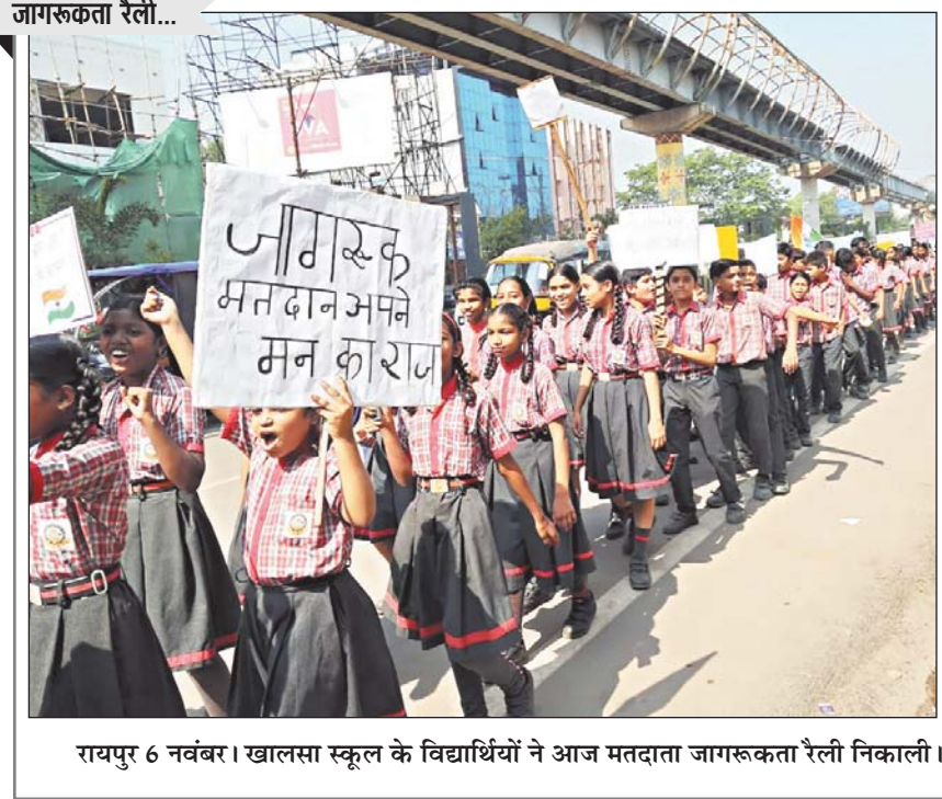
रायपुर 6 नवंबर। खालसा स्कूल के विद्यार्थियों ने आज मतदाता जागरूकता रैली निकाली।

कार्यालय के अनुसार राज्य में 100 वर्ष की आयु पूर्ण करने वाले मतदाताओं की संख्या 2,462 है। जबकि 80 वर्ष से अधिक उम्र के मतदाताओं की संख्या 1,60,000 है। रायपुर जिले में आज मतदान केंद्रों में विद्युत, पेयजल सहित अन्य व्यवस्थाओं के लिए जिला निर्वाचन अधिकारियों ने दौरा किया है।