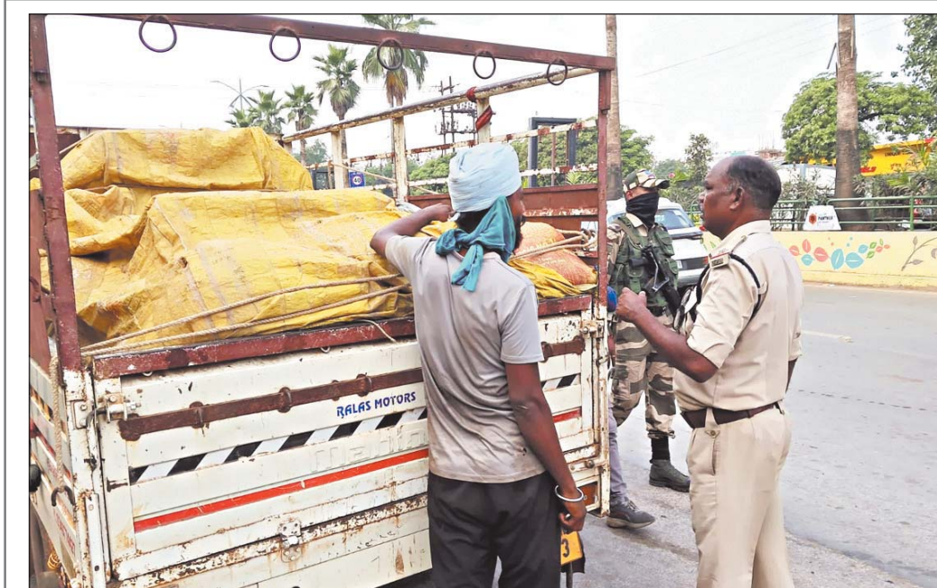
रायपुर 31 अक्टूबर। विधानसभा चुनाव के मद्देनजर मालवाहकों की तलाशी ली जा रही है।