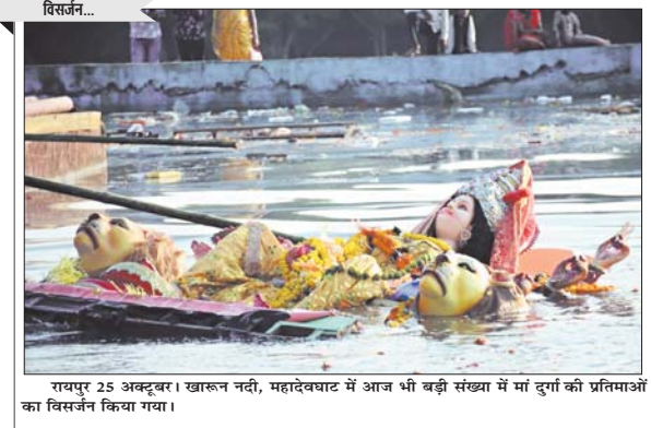
रायपुर 25 अक्टूबर। खारून नदी, महादेवघाट में आज भी बड़ी संख्या में मां दुर्गा की प्रतियाओं का विसर्जन किया गया।

रायपुर, 25 अक्टूबर। छत्तीसगढ़ में अचानक मौसम के मिजाज में बदलाव आ गया है। सप्ताह भर पूर्व तक चिपचिपी गर्मी से बेहाल लोगों को अब गुलाबी ठंड का एहसास हो रहा है। सुबह और शाम ढलने के बाद ठंड का असर आसानी से महसूस हो रहा है। छत्तीसगढ़ के अधिकांश जिलों में न्यूनतम तापमान का प्राफ अब गिर गया है। बात उत्तरी छत्तीसगढ़ की करें तो यहाँ के कोरिया में न्यूनतम तापमान का आंकड़ा 14.9 डिग्री रिकार्ड किया गया है। इसी तरह बलरामपुर में 17.4, सरगुजा में 16.8, जशपुर में 17.8, रायगढ़ में 20.5, कोरवा में 17.8 डिग्री रिकार्ड किया गया है। इसी तरह बिलासपुर में 18.4, मुरली 17.3, जांजीर-चांपा में 19.1, रायपुर 19.3, महासमुंद्र 17.5, दुर्ग 16.2, राजनांदीव 17.2, धमरगौरी 15.7, कांकेर 15.2, नागधामपुर 14.2, बस्तर 18.4, देवावड़ा 17.0 तथा जोरापुर में 17.5 डिग्री न्यूनतम तापमान रिकार्ड किया गया है। मौसम विभाग के अनुसार आने वाले दिनों में की दिशा में बदलाव होते ही तापमान में और ज्यादा गिरावट आने की पूरी संभावना बनी हुई है।