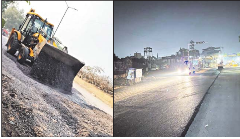
लिया गया था, अब बारिश थम जाने के बाद डामरीकरण के काम में तेजी आई है।