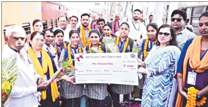
राष्ट्रीय स्तर पर आयोजित हुए इस प्रतिযোগिता में देश के कई क्षेत्रों से 18 आगे बढ़ने के लिए सुनहरे कल नाम के

नेशनल इंस्टीट्यूट ऑफ साइंस एंड टेक्नोलॉजी की ओर से संचालित किये गये इस टैलेंट सर्च कॉम्पिटिशन का उद्देश्य एजुकेशन, एप्लीकेशन, साइंस और टेक्नोलॉजी से जुड़े नए आईडियास को मंच देने था।