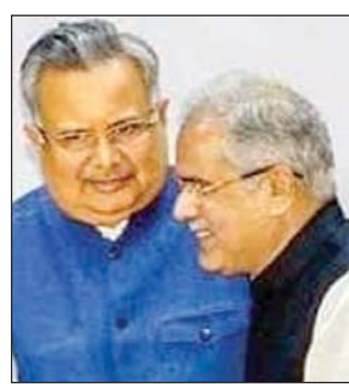
को उनके घर में घेरने की रणनीति कांग्रेस ने बनाई है। वैसे भाजपा के लगभग सभी बड़े नेता पूर्व सीएम, नेता प्रतिपक्ष, सभी पूर्व मंत्री, 4 सांसद, भाजपा अध्यक्ष, 3