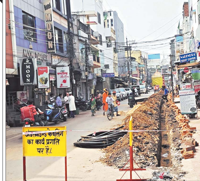
रायपुर 19 अक्टूबर। राजधानी के विभिन्न स्थलों पर कार्य कई दिनों से इस तरह से प्रगति पर है।