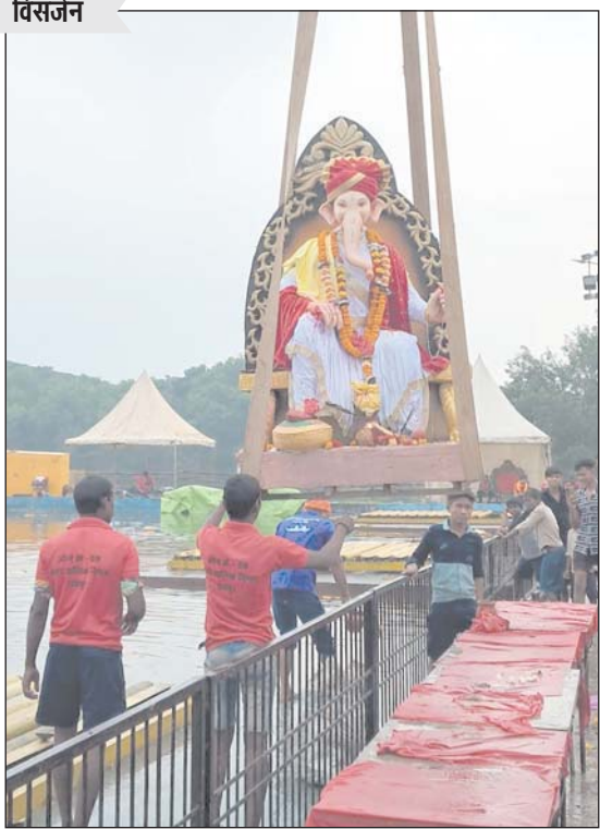
रायपुर, 29 सितम्बर। महादेवघाट स्थित विसर्जन कुंड में आज राणेश प्रतिमाओं का विसर्जन करने श्रद्धालुओं का तांता लगा रहा।