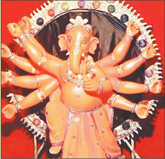
रायपुर 23 सितंबर । श्री सिकंदर गणेशोत्सव समिति ।

कांग्रेस में प्रत्याशी चयन को लेकर मंथन : कांग्रेस ने प्रत्याशी चयन को लेकर मंथन शुरू कर दिया है। चुनाव समिति की बैठक में कुल 69 विधानसभा क्षेत्र के लिए प्रत्याशियों के नामों पर चर्चा हुई। इसमें कुमारी शैलजा, टीएस सिंहदेव शामिल हुए। यहां से नाम को हरी झंडी मिलने के बाद इसे केंद्रीय चुनाव समिति को भेजा जाएगा। कांग्रेस के नेता राहुल गांधी भी बिलासपुर आने वाले है। इसको लेकर भी सभी तैयारियां तेज कर दी गई है। दो अक्टूबर गांधी जयंती से भरोसा यात्रा शुरू होगी।