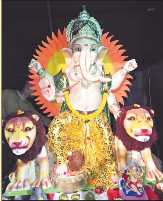
रायपुर 23 सितंबर । श्री-श्री बाल युवा गणेशोत्सव समिति ।