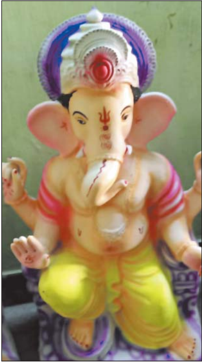
कवर्धा। गांव रीवापार में गणेश भगवान की मूर्ति विराजित