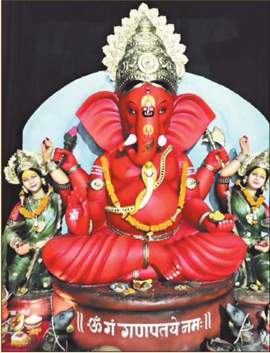
रायपुर 23 सितंबर । श्री गौरी-गौरा गणेशोत्सव समिति ।

किसान नेताओं ने लगाया आरोप, उम्रदराज किसानों को हो रही परेशानी