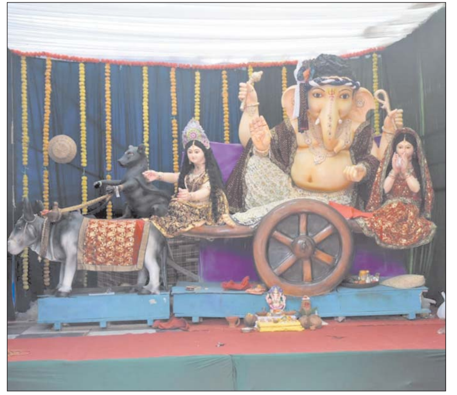
शिव गणेशोत्सव समिति कपड़ा मार्केट चौक पडरी में साबूदाना की पगड़ी व सिंघाड़ा तथा मूंगफली से निर्मित गणेश जी की प्रतिमा।