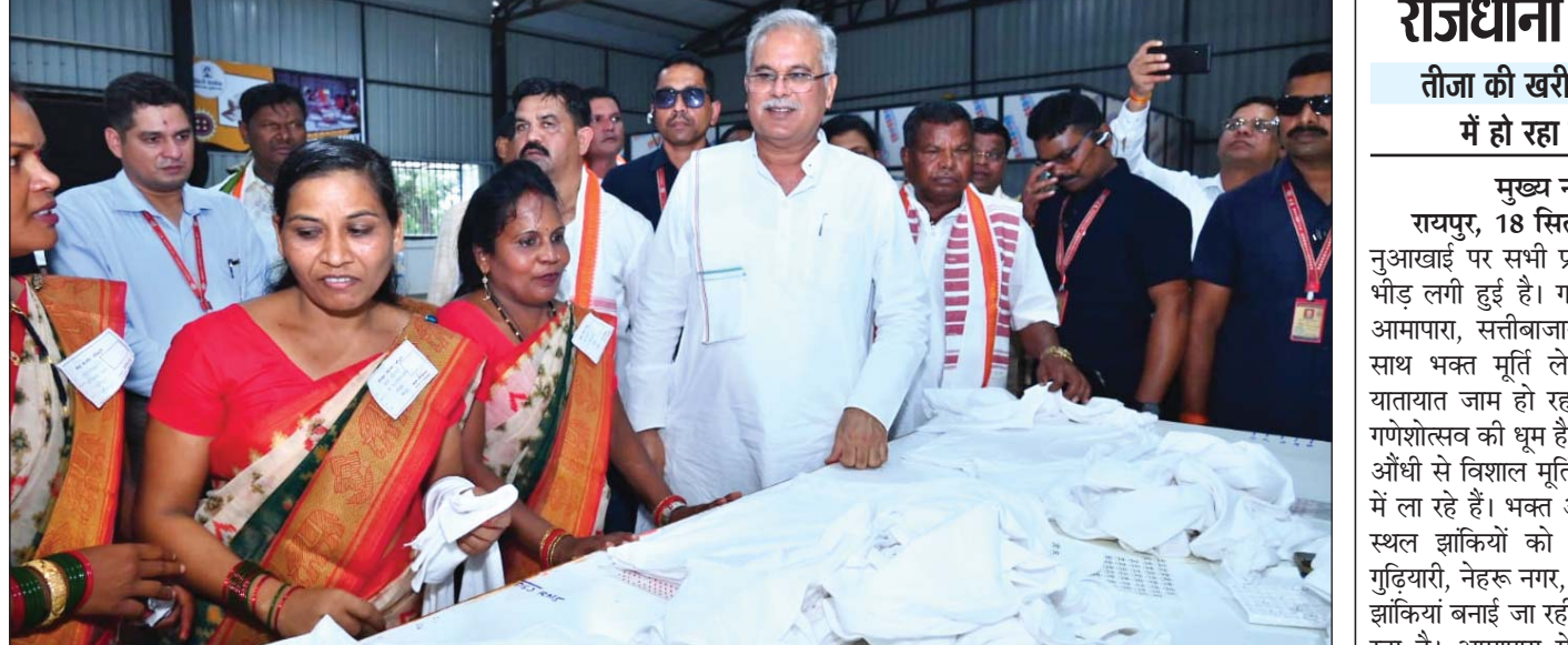
बीजापुर, 18 सितंबर। मुख्यमंत्री भूपेश बघेल ने ईटपाल स्थित बीजापुर गवर्नमेंट फैक्ट्री का लोकार्पण किया। इस अवसर पर उन्होंने गारमेट फैक्ट्री में चल रहे कपड़ा निर्माण के कार्यों का निरीक्षण भी किया और यहां कार्यरत महिलाओं से बात की। बघेल ने फैक्ट्री से हरी झंडी दिखाकर बाजार के लिए तैयार उत्पादों की पहली खेप को रवाना किया।

मुख्य नगर संवाददाता रायपुर, 18 सितंबर। राजधानी में तीजा एवं नुआखाई पर सभी प्रमुख बाजारों में खरीदारों की भीड़ लगी हुई है। गणेश प्रतिमा खरीदने के लिए आमपारा, सतीबाजार, रामकुंड से बाजे-गाजे के साथ भक्त मूर्ति ले जा रहे हैं जिसके कारण यातायात जाम हो रहा है। राजधानी में इस समय गणेशोत्सव की धूम है। भक्त माना तथा दुर्ग के पास औंधी से विशाल मूर्तियां बाजे-गाजे के साथ ट्रेलरों में ला रहे हैं। भक्त आकर्षक सजावट के अलावा स्थल झांकियों को भी अंतिम रूप दे रहे हैं। गुडियारी, नेहरू नगर, कालीबाड़ी चौक में आकर्षक झांकियां बनाई जा रही हैं। इसे अंतिम रूप दिया जा रहा है। आमपारा में सड़क किनारे रक्षाबंधन से अभी तक बाजार लगाया जा रहा है। जिसके कारण आजाद चौक से लेकर विवेकानंद आश्रम एवं आमपारा में जाम लगा रहता है वहीं सतीबाजार में