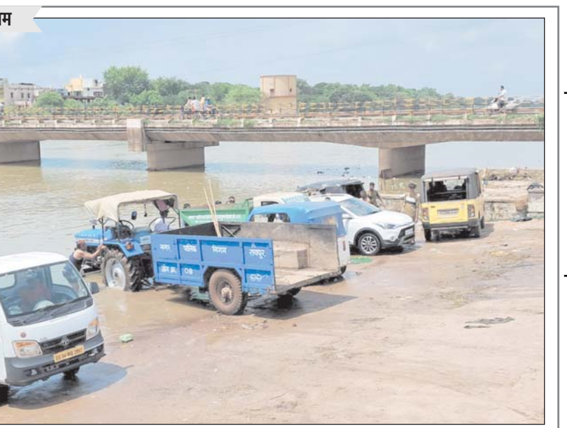
रायपुर, 17 सितम्बर। खारुन नदी महादेवघाट में जोखिम लेकर गाड़ियों की धुलाई की जा रही है।