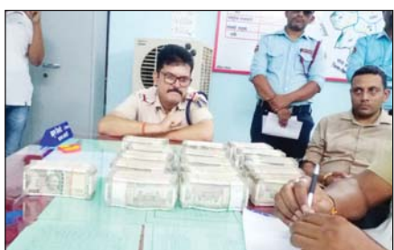
मनेन्द्रगढ़-चिरमिरी-भरतपुर, 8 सितंबर।

छत्तीसगढ़ के मनेन्द्रगढ़ से बड़ी खबर सामने आई है। विधानसभा चुनाव को लेकर लगातार चेकिंग कार्रवाई के दौरान मनेन्द्रगढ़-घुटरीटोला चेक पोस्ट पर पुलिस ने नोटों की गड्डी बरामद की है। पुलिस ने मध्यप्रदेश से छत्तीसगढ़ आ रही एक कार से 40 लाख रुपये कैश बरामद किया है। पूछताछ में एक संदिग्ध व्यक्ति ने खुद को व्यापारी बताया है। यह कार्रवाई खोंगापानी पुलिस चौकी की टीम ने की है। संदिग्ध व्यक्ति से जब पुलिस ने पैसों को लेकर दस्तावेज मांगा तो उसने कोई भी दस्तावेज प्रस्तुत नहीं किया है। पुलिस व्यापारी से पूछताछ कर रही है। वहीं पुलिस ने इस पूरे मामले जानकारी उच्च