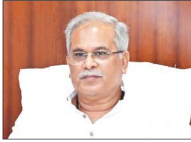
रायपुर, 8 सितंबर

छत्तीसगढ़ के मुख्यमंत्री भूपेश बघेल ने शुक्रवार को कहा कि वह राष्ट्रपति के जी20 रात्रिभोज में शामिल नहीं होंगे। शिखर सम्मेलन के लिए सुरक्षा सावधानियों के कारण दिल्ली के अंदर और बाहर जाने वाली कोई गैर-निर्धारित उड़ानें नहीं हैं। बघेल ने कहा कि भाई, अब तो नो फ्लाईजोन हो गया है। कैसे जाएंगे (दिल्ली अब नो-फ्लाईजोन बन गया है। मैं कैसे जाऊं? सरकार ने