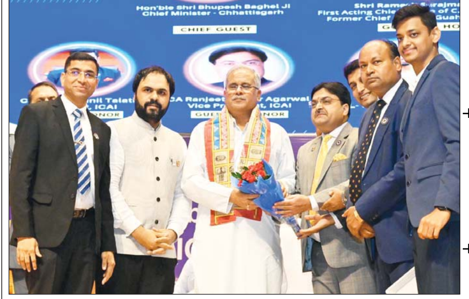
रायपुर, 6 अगस्त। मुख्यमंत्री भूपेश बघेल ने द इंस्टीट्यूट ऑफ चार्टर्ड अकाउंटेंट्स ऑफ इंडिया के राष्ट्रीय अधिवेशन का आज शुभारंभ किया।

दरें पर चलने वाले बयान पर भी निशाना साधते हुए कहा, देश की संपत्ति को बेच देंगे तब हर स्तर पर विरोध होगा। नगरनार बना रहे हैं, अब तक शुरू भी नहीं हो पाया। इसका विरोध नहीं होना चाहिए? आगे भूपेश बघेल ने अमृत मिशन योजना के तहत रेलवे स्टेशनों के विस्तार पर कहा, प्रधानमंत्री को मैंने पत्र भी लिखा है, ट्रेनें लगातार लेट से चल रही है और बहुत सी निरस्त भी हो गई हैं। यह बहुत दुखद है, छत्तीसगढ़ में विरल बसाहट है, आवागमन के लिए ट्रेन अच्छी सुविधा है।