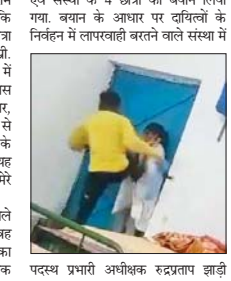
पदस्थ प्रभारी अधीक्षक करदगाता झाड़ी

बीजापुर-2 अगस्त ■ तरुण छत्तीसगढ़ प्री-मैट्रिक बालक छात्रावास आगबिबी की घटना संबंधी वीडियो वायरल होने पर प्रशासन ने त्वरित कार्रवाई की है। छात्रावास अधीक्षक को तत्काल प्रभाव से निलंबित कर दिया गया है। वहीं मंडल संयोजक को कारण बताओ नोटिस जारी किया है। जिसके साथ वह छात्र ने छात्रा के पेट पर लात मारी। 31 जुलाई की शाम यह वीडियो व्हाट्सअप के माध्यम से भरे संसंगत में लाया गया। सहायक अधीक्षक ने बताया कि मामले को संसंगत में लेते हुए 1 अगस्त की सुबह घटना स्थल पर पहुंच कर वस्तुस्थिति का जायजा लिया गया। स्वस्थ के अधीक्षक