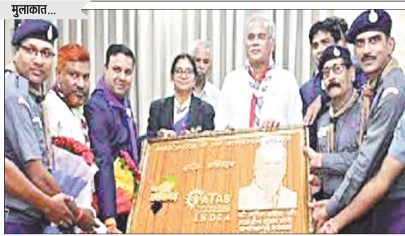
रायपुर 1 अगस्त। मुख्यमंत्री भूपेश बघेल से यहां उनके निवास कार्यालय में भारत स्काउट्स एवं गाइड्स छत्तीसगढ़ राज्य मुख्य आयुक्त एवं संसदीय सचिव विनोद सेवनलाल चन्दाकर के नेतृत्व में आए स्काउट गाइड के प्रतिनिधिमंडल ने सौजन्य मुलाकात की।

निगम का है। निगम के अधिकारियों का कहना है कि जल जीवन मिशन का काम केंद्र सरकार के अधीन संचालित हो रहा है। इस समय दूसरी पाइप लाइन बिछाने का काम चल रहा है। जीई रोड में शारदा चौक से लेकर आमापारा चौक तक इस समय गड़पाटने का काम चल रहा है। जवाहर नगर से लेकर बड़ई पारा में भी हालत खराब है। बसतक होने के कारण यहां पर पानी भर गया है जिसके कारण वाहन चालकों को काफी परेशानी हो रही है। शासकीय प्रवक्ता के अनुसार नगर निगम के अधिकारियों को भी सचेत किया गया है कि वे शहर के अंदर जितने भी गड़दें हैं उनको शीघ्र भरें।