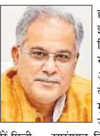
सारांगगढ़-बिलाईगढ़ जिले के युवाओं, महाविद्यालयीन छात्र-छात्राओं, प्रतियोगी परीक्षा की तैयारी कर रहे प्रतिभागियों सहित अन्य सभी युवा 1 अगस्त को बहतराई इंडोर स्टेडियम में मुख्यमंत्री से सीधी बातचीत करेंगे। इस कार्यक्रम में बिलासपुर संभाग के सभी 8 जिलों से युवा यहां हजारों की तादाद में पहुंचेंगे।