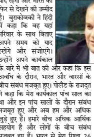
क्रॉइड महामारी के दौरान, हमने अवीथ के दौरान, भारत और वार्सॉ के बीच संबंध मजबूत हुए।

क्रॉइड महामारी के दौरान, हमने अवीथ के दौरान, भारत और वार्सॉ के बीच संबंध मजबूत हुए। पोलेड के राजतु ने कहा कि मेरा काकलत पांच साल का था और इन पांच सालों के दौरान संबंध मजबूत हुए और आज भी और अधिक जुड़े हुए हैं। हमारे बीच अधिक आर्थिक सहयोग है और लोगों के बीच संबंध मजबूत हुए हैं। भारत से मेरा रिश्ता 26