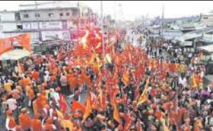
नगर के सरस्वती विद्यालय के बच्चों श्रीराम, माता सीता, लक्ष्मण व हनुमान जी की वेशभूषा में नगर आए। भगवान श्रीराम जी की झांकी की जगह जगह लोगों ने आरती कर पुष्प वर्षा के साथ स्वागत किया। इस अवसर पर मोर्चे पर तिलक व गुआ, सिर में भावा साजा बांधे हुए बच्चे, बुजुर्ग, युवा, महिलाएं सभी बड़ी संख्या में सम्मिलित हुए। इधर शोभायात्रा से पूर्व रामायण मंडली द्वारा पुजा स्थल पर सुरदेवकांड पाठ का आयोजन भी किया गया उसके पश्चात नगर में छत्तीसगढ़ का प्रशाह डेजेन पावर जेन के साथ भव्य शोभायात्रा निकाली गई। वहीं धमती की फेमस आकाशीय आतिथबाजी ने इस शोभायात्रा की खूबसूरती बढ़ा दी। बात दे कि इस बार

नगर को सजाने के लिए विशेष रूप से शहर व सड़कियों की व्यवस्था की गई थी जिससे पूर्व नवरात्रि पर्व में नगर पूरी तरह से प्रकाशमान रहा। साथ ही बस्तर के मशहूर शिल्प नृत्यकों का समूह इस शोभायात्रा में शामिल हुआ। महोत्सव कलश के साथ शोभायात्रा में आमो चल रही थी। अंत में शंभुनाद के साथ ऐतिहासिक महाआरती के बाद इस शोभायात्रा का समापन हुआ। कार्यक्रम में पहुंचे सभी लोगों को पंडरा एवं प्रसाद का वितरण किया गया। कार्यक्रम में गौदम, वासपुर, होरावन, कासोली, घोटापाल कदूनगर स्थित आस्थापन के प्रामोयि श्रेणों से बड़ी संख्या में लोग सम्मिलित हुए। इस पर आयोजन को सफल बनाने में नगर के सभी आयोजन कार्यकर्ता समेत व्यवस्था बनाने रखने पुलिस एवं प्रशासन का भी महत्वपूर्ण योगदान रहा। कार्यक्रम सफल बनाने को लेकर आयोजन समिति द्वारा सभी का आभार भी व्यक्त किया गया।