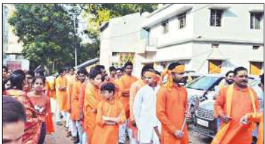
जगदलपुर 31 मार्च। सरसूपुरीय ब्राह्मण समाज द्वारा रामनवमी के अवसर पर विशाल रैली निकाली गया।