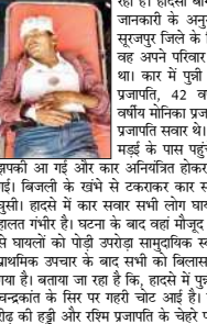
इसकी आ गई और कार अनिश्चित होकर इलेक्ट्रिक पोल से टकरा गई।

कोरबा, 31 मार्च। छत्तीसगढ़ के कोरबा जिले में एक तेज रफ्तार कार बिजली के पोल से टकराकर खंडी टुक में जा घुसी। इस हादसे में कार सवार 5 लोग घायल हो गए हैं, जिनमें 3 की हालत गंभीर बताई जा रही है। हादसा बांगो थाना क्षेत्र का है। मिली जानकारी के अनुसार, 56 वर्षीय पुत्री राम