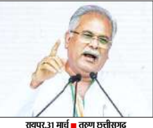
रायपुर, 31 मार्च | तरुण छत्तीसगढ़

साम्. उन्होंने आगे लिखा है जनसमूह के शिष्ट युवाओं को 1 अप्रैल से 2500 प्रति माह बेरोजगारी भत्ता देने का आदेश जारी किया गया है. पंजीन में सुगमता के लिए एफ निर्णय लिया गया है कि अर्जत नाम में किसी भी दिर ग ए आवेदन कर घोषणा अनुसार भत्ता 1 अप्रैल से ही वर होगा. आशा है ये भत्ता हमारे युवाओं के स्वल्पनको दिशाम ए एक मौल का पकर साहित होगा।