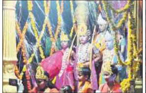
गौदम 31 मार्च। चैत्र नवरात्र के अंतिम दिन यथावत् पुरुषोत्तम भगवान श्रीराम के जन्मोत्सव का पावन वरं रामनवमी गौदम नगर में धूमधाम से मनाया गया। श्री राम जन्म उत्सव समिति गौदम व नगर के सर्व सिद्ध समज द्वारा भव्य कार्यक्रम का आयोजन किया गया। इस दौरान नगर में भीष्म शोभायात्रा एवं भगवान श्रीराम की झांकी निकाली गई जहां हजारों की संख्या में श्रद्धालुओं शामिल हुए। शोभायात्रा नगर के बस स्टैंड परिसर स्थित पुजा स्थल से शुरू होकर नगर के मुख्य मार्ग से होते हुए हारम