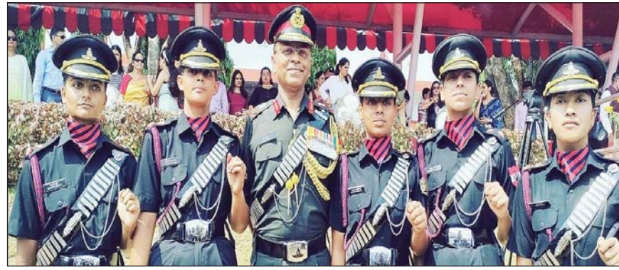
सर्विलांस एंड टारगेट एंक्रिजेशन और उपकरणों को संभालने के लिए पर्याप्त प्रशिक्षण और एक्सपोजर मिलेगा। डीजी आर्टिलरी आदोष कुमार ने बताया कि रेजीमेंट आर्टिलरी के लिए महिला अधिकारियों का यह एक महत्वपूर्ण अवसर है। हमें उनकी क्षमता पर पूरा भरोसा है और यकीन है कि वे भविष्य में कमांड आर्टिलरी यूनिट सहित अपने संबंधित भविष्य में बहुत अच्छे कार्य करेंगीं।

आर्टिलरी की रेजिमेंट में कमीशन की जा रही पांच महिला अधिकारियों (डब्ल्यूओ) को उनके पुरुष समकक्षों (19 पुरुष अधिकारियों को भी आर्टिलरी में कमीशन किया जाता है) के समान अवसर और चुनौतियां प्रदान की जा रही हैं। इन युवा महिला अधिकारियों को सभी प्रकार की आर्टिलरी इकाइयों में तैनात किया जा रहा है, जहां उन्हें चुनौतीपूर्ण परिस्थितियों में रॉकेट, मीडियम, फील्ड और