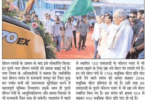
शोधन संयंत्रों के उन्नयन के बाद इसे लोकार्पित किया। इन पुराने जल शोधन संयंत्रों को लम्बे बहुरे गे है। नगर निगम के अधिकारियों ने बताया कि नवनिर्मित जल शोधन संयंत्र से राजधानी रायपुर को टैकर मुक्त कर पानी पानी की उपलब्धता सुनिश्चित करने में महत्वपूर्ण भूमिका निभाएगा। इसके साथ ही पुराने शोधन यंत्रों के आधुनिककरण और क्षमता विस्तार से भी राजधानी टैकर मुक्त हो सकेगी। भाटागांव में पहले से स्थापित 150 एमएलडी के फील्डर प्लांट में भी क्षमता बढ़ाने के लिए छह नये मोटर पर लगाये गये है। इन नये मोटर पंपों से 1706 क्यूबिक मीटर प्रति घंटा पानी देने वाले संयंत्र की क्षमता बढ़कर 2046 क्यूबिक मीटर प्रतिघंटा हो गई है। इसी तरह 80 एमएलडी के पुराने फील्डर प्लांट में भी छह नये मोटर स्थापित किए गए है। इस संयंत्र की क्षमता 954 से बढ़कर 995 क्यूबिक मीटर प्रति घंटा हो गई है।

मुख्यमंत्री श्री भूपेश बघेल ने आज रायपुर दक्षिण विधानसभा में भेंट-मूलाकत के दौरान भाटागांव में 80 एमएलडी क्षमता के नये जल शुद्धिकरण संयंत्र का लोकार्पण कर शहरवासियों को बड़ी सौगात दी। यह संयंत्र छत्तीसगढ़ का पहला जंगी वेस्ट, वॉटर ट्रीटमेंट प्लांट है। कार्यक्रम में उन्होंने ठेस अपशिष्ट प्रबंधन के लिए नगर निगम रायपुर के 9 बैंक हो लोड गार्डियों को भी हरी झंडी दिखाकर स्वामा किया। अग्यधुनिक जल शोधन संयंत्र लागण 15 करोड़ 86 लाख रुपये की लागत से तैयार किया गया है। इस संयंत्र का संचालन तैराला ट्यूब वेक्टर पद्धति से किया जाएगा, यह पूरी तरह से स्वचालित प्रणाली पर आधारित है। संयंत्र से प्राप्त जल से शहर के देवेन्द्र नगर, मोतीबाग, नलवर, बैरनबाजार, सनन नगर तथा मठपुरना के छह बड़ी टैंकों को भरा जाएगा और जिससे शहर की बड़ी आबादी को शुद्ध एवं पका पिसल उल्लख हो पायेगा।