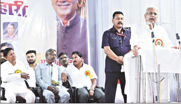
सामाजिक तत्त्वकी के लिए शिक्षा पर विशेष विशेष बल देने की बात कही।

उन्होंने कहा एकता व संगठन के लिए विचारों का सकारात्मक होना अति आवश्यक है और सकारात्मक विचार शिक्षा ही दे सकती है। इसलिए उन्होंने उपस्थित जनो को