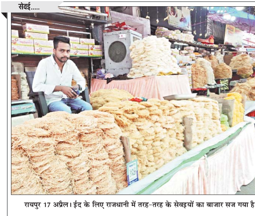
रायपुर 17 अप्रैल। इंद के लिए राजधानी में तरह-तरह के सेवइयों का बाजार सज गया है।

डिहाइड्रेशन के चलते लोगों की तबीयत खराब होना शुरू हो गई। इसके बाद 50 से ज्यादा लोगों को अस्पताल में भर्ती कराया गया। इनमें से 11 की मौत हो चुकी है। मुख्यमंत्री एकनाथ शिंदे ने मृतक के परिजनों को मुआवजे के रूप में 5 लाख रुपए दिए जाने का ऐलान किया है। इसके साथ ही उन्होंने सभी मरीजों का सरकार द्वारा उचित इलाज कराए जाने की बात कही है। अस्पताल में अभी भी 50 से ज्यादा लोगों का इलाज चल रहा है, जिसमें से कुछ की स्थिति गंभीर है। इस कार्यक्रम में मुख्यमंत्री एकनाथ शिंदे और उपमुख्यमंत्री देवेन्द्र फडणवीस और सरकार के कई अन्य मंत्री भी शामिल हुए थे।