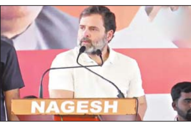
आरएसएस द्वारा हमला किया जा रहा है। वे भारत में नफरत और हिंसा फैला रहे हैं। इसके साथ ही राहुल ने वहां के लोगों से कई वादें भी किए। राहुल ने कहा कि चुनाव जीतने के बाद कांग्रेस पार्टी की सरकार कर्नाटक में जो 4 वादे कर रही है वो यह हैं पहला वादा गृह लक्ष्मी 2000 रुपए हर महिने महिलाओं को, दूसरा गृह ज्योति 200 यूनिट मुफ्त बिजली, तीसरा अन्न भाव्य 10 किलो चावल हर परिवार को, चौथा वादा युवा निधी 2 साल के लिए

कर्नाटक चुनाव को लेकर प्रचार में धार दिखनी शुरू हो गई है। कांग्रेस ने चुनाव जीतने के लिए अपनी पूरी ताकत लगा दी है। कांग्रेस के वरिष्ठ नेता राहुल गांधी आज राज्य के बीदर में थे। इस दौरान उन्होंने भाजपा पर जबरदस्त तरीके से निशाना साधा। राहुल ने कहा कि भारत में अगर पहली बार लोकतंत्र की बात किसी ने की और उसे रास्ता दिखाया तो वो बसवन्ना जी थे। इसके साथ ही उन्होंने कहा कि दुख की बात है कि आज आरएसएस और भाजपा के लोग लोकतंत्र पर हमला कर रहे हैं। उन्होंने कहा कि बसवन्ना जी की सभी की भागीदारी, सभी के लिए एक जगह और सभी को एक साथ आगे बढ़ना चाहिए की सोच पर भाजपा और