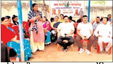
कांग्रेस की जनसत्याग्रह सभा आयोजित