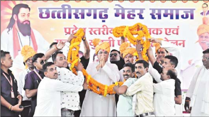
मुख्यमंत्री श्री बघेल ने कहा कि संविधान में लोगों को सामाजिक न्याय दिलाने के लिए आरक्षण का प्रावधान किया

रायपुर, 17 अप्रैल। संतों ने लोगों को समानता के साथ जीने का मार्ग बतायासंतों ने लोगों को समानता के साथ जीने का मार्ग बतायासंतों ने लोगों को समानता के साथ जीने का मार्ग बताया मुख्यमंत्री श्री भूपेश बघेल आज महादेव खाट रोड स्थित सतनाम भवन में आयोजित छत्तीसगढ़ मेहर समाज के प्रदेश स्तरीय सामाजिक एवं युवक-युवती परिचय सम्मेलन में शामिल हुए। इस अवसर पर उन्होंने कहा कि महान संत श्री रविदास ने कर्म को ही पूजा कहा। कोई काम छोटा नहीं होता है। लोग अपने विचारों से छोटे होते हैं। भक्तिमार्ग में संत रविदास का नाम पूरी दुनिया में श्रद्धा से लिया जाता है। संतों ने लोगों को समानता के साथ जीने का मार्ग बताया। मुख्यमंत्री ने इस अवसर पर नया रायपुर में संत रविदास के नाम से चौक का नामकरण तथा रविदास की जयंती मनाने के लिए प्रतिवर्ष 5 लाख रुपए की राशि देने की घोषणा की।