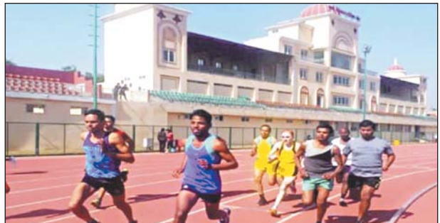
राष्ट्रीय स्तर पर पदक प्राप्त विजेता खिलाड़ी और राष्ट्रीय स्तर की स्पर्धाओं में भाग ले चुके खिलाड़ियों ने बवाल मचा दिया है। अनुशासन में रहकर अपने खेल का शानदार प्रदर्शन करने वाले खिलाड़ियों का यह व्यवहार वस्तुतः छत्तीसगढ़ शासन के खेल विभाग की गतिविधियों के खिलाफ खुला भड़सा है। ताज्जुब की बात है कि छत्तीसगढ़ में कांग्रेस सरकार बनने के बाद सिर्फ एक ऐसा संचालक का पद है जिसमें पिछले चार वर्षों से कोई परिवर्तन नहीं किया गया है। छत्तीसगढ़ शासन में किसी संचालक के लंबे समय तक एक ही स्थान पर पदस्थ रहने का कीर्तिमान वर्तमान खेल संचालक के नाम दर्ज है। लगातार चार वर्षों से पदस्थ रहते हुए छत्तीसगढ़ शासन की खेल नीति को अपार वह लागू नहीं कर सकी है तो यह छत्तीसगढ़ की खेल संभावनाओं के साथ कुटाराघात है। उच्च पद पर आसीन व्यक्ति को अपने दायित्व के प्रति ना सिर्फ गंभीर होना चाहिए बल्कि अधिनस्थ सहयोगियों

खेलकूद की महत्ता को देखते हुए परिवार के सदस्य अपने नन्हें-मुन्नों को खेल में भाग लेने के लिए प्रोत्साहित करते हैं। उसके पश्चात आंगनवाड़ी से लेकर महाविद्यालय तक नौनिहालों को खेलकूद में भाग लेने की दिशा बताई जाती है। शासकीय तौर या फिर ओलंपिक संघ या खेल संघों की ओर से कम आयु में बालक/बालिकाओं का चयन के आधार पर विभिन्न खेलों के लिए किया जाता है। भारतीय ओलंपिक संघ द्वारा 26 खेलों को मान्यता दी गई है। छत्तीसगढ़ में स्थानीय स्तर पर छत्तीसगढ़िया ओलंपिक खेलों के माध्यम से पुरातन, ग्रामीण खेलों को बढ़ावा दिया जा रहा है। इन खेलों में शामिल होने के लिए खिलाड़ियों के चयन से लेकर प्रशिक्षण फिर विभिन्न स्तर के प्रतियोगिताओं तक प्रतिभागियों को केंद्र, राज्य सरकार के खेल विभाग, शिक्षा विभाग आदि के द्वारा सहयोग दिया जाता है। राष्ट्रीय व अंतर्राष्ट्रीय स्तर पर ओलंपिक या गैर ओलंपिक खेलों में प्रदर्शन के आधार पर छत्तीसगढ़ के खिलाड़ियों को पुरस्कृत किए जाने तथा लगातार पदक जीतने वालों को उत्कृष्ट खिलाड़ी घोषित किए जाने का प्रावधान है। ऐसे खिलाड़ियों को शासकीय सेवा का अवसर दिया जाता है। छत्तीसगढ़ राज्य बनने के बाद प्रतिभाशाली खिलाड़ियों को शासकीय सेवा दी जा रही है। परंतु 2019 के बाद ऐसा करने में खेल विभाग की तरफ से एक-दो उदाहरण को छोड़ दिया जाए तो ढिलाई हो रही है। इसकी वजह से