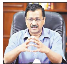
विधानसभा में जिस दिन भ्रष्टाचार के खिलाफ बोला था, उसी दिन मैं जान गया था कि अल्ला नंबर मेरा होगा। उन्होंने कहा कि पिछले 75 वर्षों में किसी भी पार्टी को आप की तरह निशाना नहीं बनाया गया। हमने लोगों में अच्छी शिक्षा की उम्मीद जताई है, वे इस उम्मीद को खतम करना चाहते हैं।

मुख्यमंत्री अरविंद केजरीवाल ने शराब घोटाले मामले में सीबीआई-ईडी की कार्रवाई को लेकर केंद्र की भाजपा सरकार पर जमकर हमला बोला। केजरीवाल ने कहा कि मनीष सिंसोदिया के खिलाफ सीबीआई और ईडी को आज तक एक सबूत नहीं मिला। इसके बावजूद झूठ बोलकर सिंसोदिया को फंसाया गया है। इस दौरान सीबीआई के समन के बाद दिल्ली के मुख्यमंत्री ने खुद ही अपना बचाव करते हुए कहा कि अगर केजरीवाल भ्रष्ट, तो देश में कोई ईमानदार नहीं।