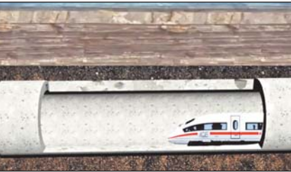
सतह से 33 मीटर नीचे देश का सबसे गहरा मेट्रो स्टॉप होगा, एक बार यह खंड पूरी तरह से चालू हो जाएगा। नदी के नीचे सुरंग पानी की सतह के स्तर से 32 मीटर नीचे है, और मेट्रो को 45 सेकंड में हुगली के नीचे 520 मीटर की दूरी तय करने का अनुमान है। सियालदह और सेक्टर डू स्टेशनों के बीच, ईस्ट-वेस्ट मेट्रो कॉरिडोर जो हावड़ा मैदान और साल्ट लेक सिटी के सूचना प्रौद्योगिकी कोर सेक्टर डू को जोड़ता है, आंशिक रूप से काम कर रहा है। पूर्व-पश्चिम मेट्रो के 16.6 किमी में से 10.8 किमी भूमिगत हैं, हावड़ा मैदान और फूलबगान के बीच हुगली नदी के नीचे यात्रा करते हैं; शेष किलोमीटर एप्लिवेटेड हैं, ईस्ट-वेस्ट मेट्रो कॉरिडोर की ऑपरेटिंग कंपनी के साथ।

मेट्रो ने इतिहास रचते हुए अपना पहला अंडरवाटर ट्रायल रन किया। यह तब है जब भारत में पहली बार एक नदी के नीचे एक सुरंग के माध्यम से मेट्रो ट्रेन दौड़ी। मेट्रो कोलकाता से हावड़ा तक हुगली नदी के नीचे चलती थी, अधिकारियों और इंजीनियरों के साथ हुगली से कोलकाता से हावड़ा तक। प्रधानमंत्री नरेंद्र मोदी ने टिवटर पर रेल निगम की उपलब्धि को साझा करते हुए इसे भारत में सार्वजनिक परिवहन के लिए एक उत्साहजनक प्रवृत्ति कहा। पीएम ने मूल रूप से केंद्रीय रेल मंत्री अश्विनी वैष्णव द्वारा पोस्ट किया गया एक वीडियो भी साझा किया। परीक्षण के बाद, अधिकारियों ने कहा कि कोलकाता में नागरिकों को आधुनिक परिवहन प्रदान करने के लिए पानी के नीचे मेट्रो एक क्रांतिकारी कदम था। ट्रायल के समय ट्रेन का एक और रैक भी उसी रास्ते से हावड़ा मैदान स्टेशन पहुंचा। उल्लेखनीय है कि कोलकाता मेट्रो (हावड़ा मैदान-एस्प्लेनेड स्टेशन) के अगले खंड का ट्रायल रन आनेवाले 5-7 महीनों में किया जाएगा, जिसके बाद मेट्रो की सेवाएं शुरू हो जाएंगी। हावड़ा मैदान