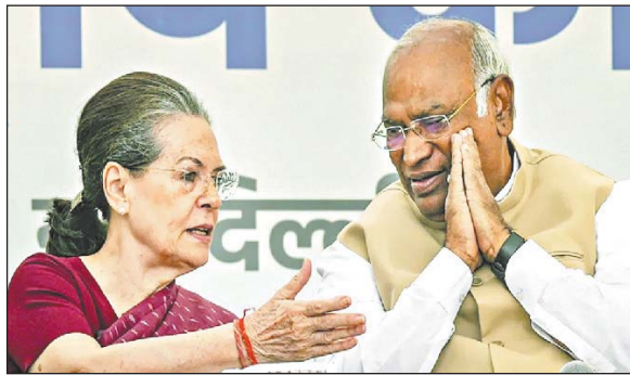
खड़गे ने दावा किया कि उनकी पार्टी के नेता राहुल गांधी को 2019 में एक आपराधिक मानहानि मामले में दोषी ठहराए जाने के 24 घंटे के भीतर लोकसभा से अयोग्य घोषित कर दिया गया था, जबकि गुजरात के एक भाजपा सांसद को एक

कांग्रेस अध्यक्ष मल्लिकार्जुन खड़गे ने कहा कि कांग्रेस की वजह से ही उनके जैसा साधारण पृष्ठभूमि का विधायक और सांसद सांसद बन सका है। तेलंगाना के मनचैरियल में जय भारत सत्याग्रह सभा ??को संबोधित करते हुए खड़गे ने कहा कि अगर इंदिरा गांधी और सोनिया गांधी ने उनके जैसे गरीब लोगों को प्रोत्साहित नहीं किया होता तो वह जनप्रतिनिधि नहीं बन पाते।