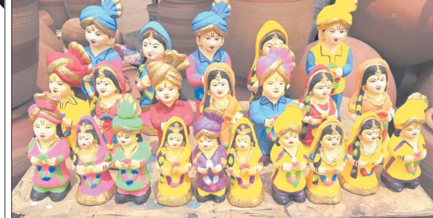
रायपुर, 15 अप्रैल। बाजार में गुड़ड़ा-गुड़िया बिकने लगे हैं। यानि अक्षय तृतीया करीब है।