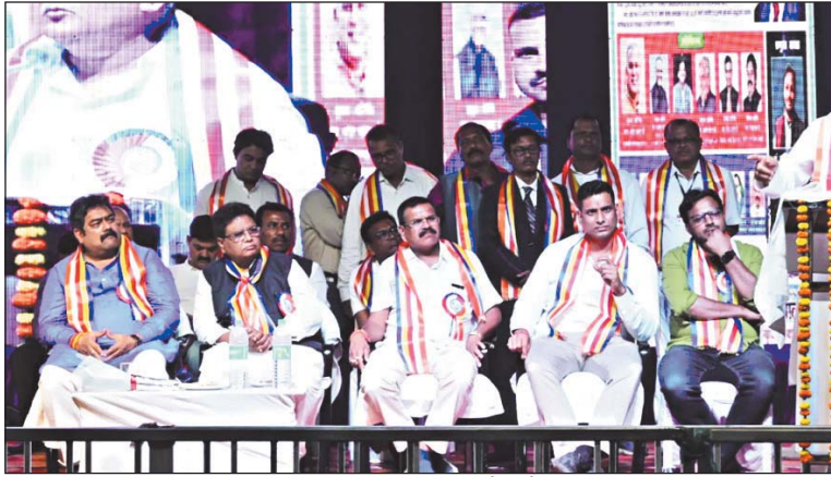
मुख्यमंत्री श्री भूपेश बघेल ने कहा कि बाबा साहब अंबेडकर ने संविधान में सबसे अच्छे आदर्शों को शामिल किया गया। बाबा साहब अंबेडकर ने अपना पूरा जीवन देश सेवा में समर्पित किया। बाबा साहब ने जो संविधान बनाया, उसमें अंतिम व्यक्ति की आवाज भी सुनाई देती है और उसका असर होता है। उन्होंने कहा कि बाबा साहब ने जो मंत्र दिया, उस रास्ते पर चलकर हमें देश को मजबूत करने की जरूरत है। बाबा साहब हमेशा संगठित होने और शिक्षा पर जोर देते थे। उनका कहना था कि एक शिक्षित राष्ट्र ही महानता की ओर बढ़ता है। भारत में अंग्रेजों की नीति फूट डालो और राज करो की थी। बाबा साहब ने इस बात को समझा और समाज को संगठित होने का संदेश दिया। आजाद भारत में हम इस उद्देश्य को लेकर आगे बढ़ें। मुख्यमंत्री ने कहा कि हमें संविधान की गरिमा को अक्षुण्ण रखने के लिए कार्य करना है। हमारे संविधान से ही हमारे लोकतांत्रिक व्यवस्था की मजबूती है। इसके लिए हमें काम करना है। उन्होंने कहा कि हमारी पीढ़ी को

रायपुर, 15 अप्रैल। डॉ. बाबा साहब भीमराव अंबेडकर के दिखाये रास्ते पर चलकर हमें लोकतांत्रिक व्यवस्था की निरंतर मजबूती के लिए कार्य करना है। उनके जैसा संघर्ष विरले ही कर पाते हैं, लेकिन कोशिश हम सभी कर सकते हैं कि उनके मूल्यों पर चलकर उनके दिखाये रास्ते पर चलकर अपने लोकतंत्र को सुदृढ़ करने निरंतर काम कर सकें। मुख्यमंत्री श्री भूपेश बघेल ने इस आशय के विचार आज बुद्ध विहार सेक्टर-6 भिलाई में आयोजित डॉ. बाबा साहब अंबेडकर सार्वजनिक जयंती समारोह में व्यक्त किए। कार्यक्रम में मुख्यमंत्री श्री भूपेश बघेल ने डॉ. बाबा साहब भीमराव अंबेडकर द्वारा स्थापित दि बुद्धिस्ट सोसायटी ऑफ इंडिया के सेक्टर-6 भिलाई में बुद्ध विहार में चल रहे निर्माण कार्य को पूर्ण करने के लिए 25 लाख रुपए राशि देने की घोषणा भी की।