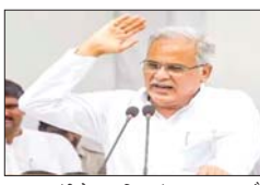
मुख्यमंत्री भूपेश बघेल

बेमेतरा के बिरनपुर में हुई सांप्रदायिक हिंसा के बाद अब सरकार एक्शन मांडू पर है। मुख्यमंत्री भूपेश बघेल ने इस घटना को लेकर बीजेपी को आड़े हाथों लिया है। मुख्यमंत्री ने सीधे तौर पर बीजेपी पर आरोप लगाया है कि भाजपा ने इस पूरे घटना की आग में पेट्रोल डालने का काम किया है। उन्होंने कहा कि इस घटना के संदर्भ में शान्ति की सोशल मीडिया पोस्ट हुए हैं, उन सभी पोस्ट की जांच हो रही है। किसने सामाजिक विद्रोह फैलाने वाले पोस्ट किये हैं, उनका उद्देश्य क्या था? रूसी बिंदुओं पर जांच होगी। मुख्यमंत्री ने इस घटना को लेकर साफ संकेत दिये हैं कि घटना के पीछे कोई किताब भी बड़ा अदमी क्यों न हो, उसके खिलाफ कार्रवाई की जायेगी। मुख्यमंत्री ने सोशल मीडिया से बात करते हुए कहा कि भाजपा की हथपंशा से मास्टरी सांप्रदायिकता और धर्मांतरण की रही है। भाजपा आग में हथपंशा पेट्रोल डालने का करती है। उन्हें जैसे ही बेमेतरा में मौका मिला, वहां उन्होंने आग लगाने की कोशिश की। उन्होंने शान्ति की अपील नहीं की, उन्हें पक्षों की मांग नहीं रखी, पीड़ित परिवार के पैसे आवाज नहीं उठायीं, बल्कि आग में पेट्रोल डालने का काम किया।