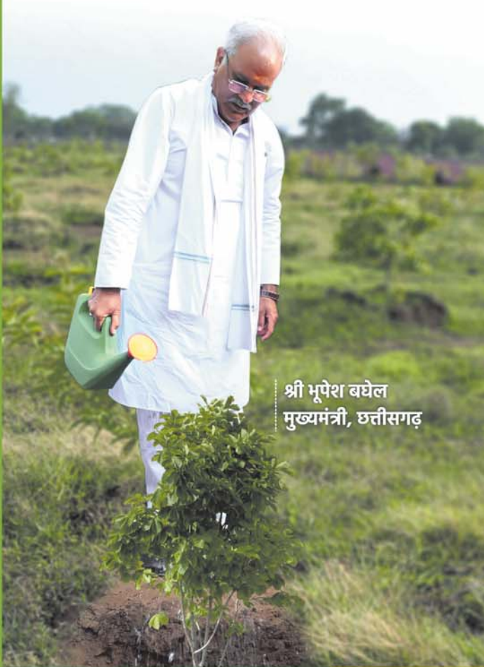
श्री भूपेश बघेल मुख्यमंत्री, छत्तीसगढ़

देश में पहली बार बड़े पैमाने पर सभी वर्ग के किसानों की पड़त भूमि पर वाणिज्यिक वृक्षारोपण