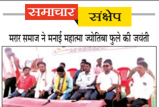
मरार समाज ने मनाई महामा ज्योतिबा फुले की जयंती

को अधूरे कार्य को जल्द प्रारंभ करने अवगत कराकर अति शीघ्र काम चालू करने को मांग पत्र दिया गया था। जिनका अभी तक कोई फलान्वयन नहीं हुआ है। किसानों की मांग है कि आगामी खरीफ फसल तक हमारा लाइनिंग का काम ग्राम पसांस के अंतिम छेत्र तक हो जाना चाहिए। अन्यथा यह कसम उठते हुए पसांस, सिरी कला, पालकरा, पाली, पंड्रा के किसानों के साथ चक्का जाम करने के लिए बाध्य होने की बात कहा गया है। और वहीं पांडुका सब डिविजन के ग्राम अतरगारा, कुदर मरा, सुपरगा के पास चल रहे नहर लाइनिंग के कार्य में भारी लोच दिखाई पड़े रहा है बिना किसी विभाग के लाइनिंग अधिकारी कर्मचारी के देखरेख ठेकेदार और उनके आदमी आन पान में कार्य को जैसे तैसे अंजाम देने में लगे हैं। और कार्य पूरा भी नहीं हुआ अभी से प्रश्नचर्चा की दररे उभरने लगे हैं। जो तो ऊपर वाले भावाना का चक्र है। जो कुछ दिनों पहले जो बारिश हुई उसमें पानी तराई हो गया जिससे नहर लाइनिंग के इस कार्य में धुआंधार ने मदद कर दी तो आज कई दररे और भी ज्यादा दिवादाई देता। यह भी विभागीय उदासीनता के कारण अधिकारी कर्मचारी और ठेकेदार की मिलीभगत से अमकर धावती का खेल चल रहा है। बिना खर्च किए सभी क्रांतीकारीकाम किया जा रहा है। नतीजा अभी से टूटने लगी है। और साल भर होते होते जाह जाह और जायदा टूटने लगने को पहलू के इन्कें नहर लाइनिंग कार्य में दिख रहा है।