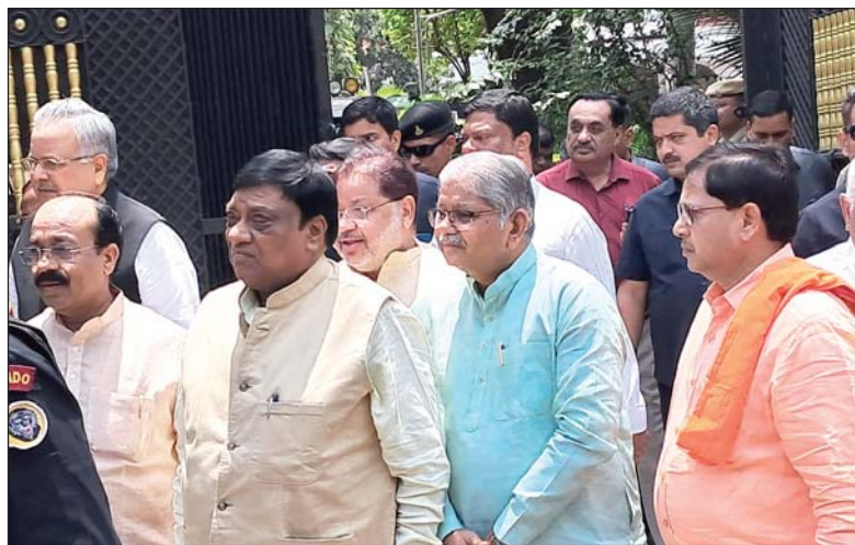
लेकर सत्तारूढ़ दल काफी चिंतित है।