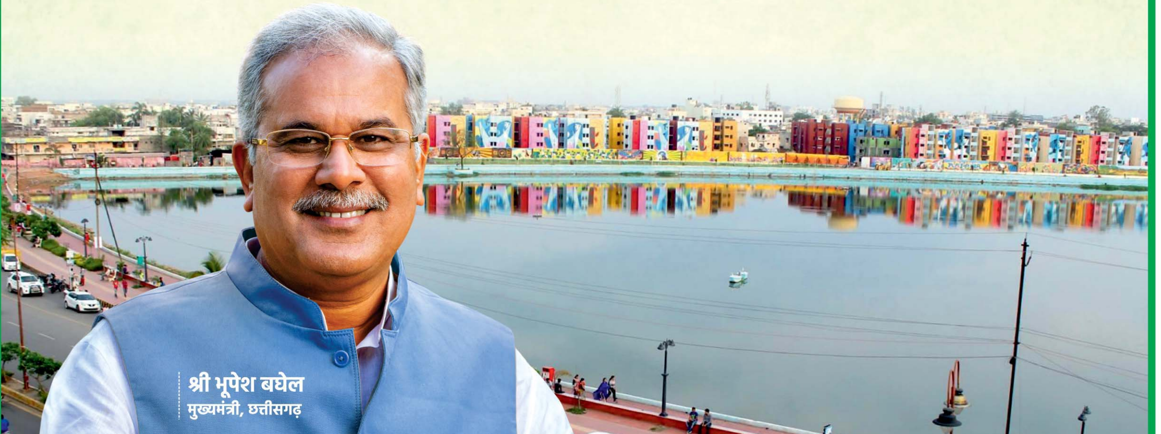
श्री भूपेश बघेल मुख्यमंत्री, छत्तीसगढ़

Visit us : ChhattisgarhCMO ChhattisgarhCMO ChhattisgarhCMO ChhattisgarhCMO DPRChhattisgarh DPRChhattisgarh www.dprcg.gov.in