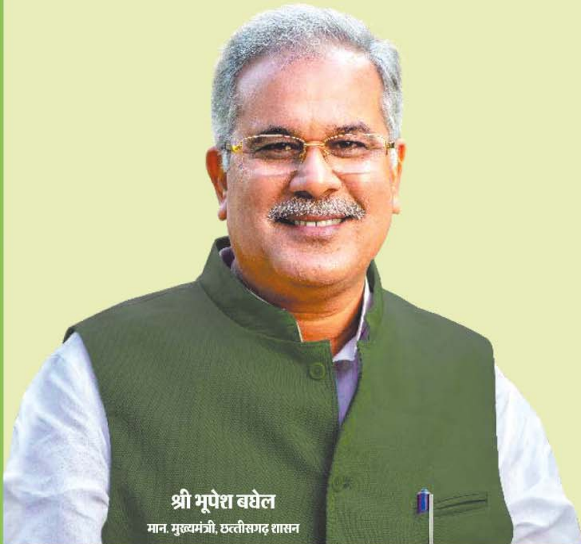
श्री भूपेश बघेल मान. मुख्यमंत्री, छत्तीसगढ़ शासन