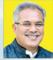
मा. भूपेश बघेल मुख्यमंत्री

आम आदमी का अपना दैनिक अखबार के स्थापना दिवस एवं श्रीरामनवमी पर हार्दिक बधाई एवं शुभकामनाएं