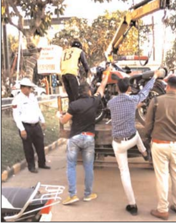
कार्यालय ले गई। इस मौके पर नेहरू नगर

भिलाई, 9 फरवरी। नगर पालिक निगम भिलाई एवं यातायात विभाग ने आज सूर्या मॉल के सामने से नो पार्किंग पर खड़े वाहनों को हटाने की संयुक्त कार्रवाई की। नो पार्किंग पर निगम की जमीन में वाहने खड़ी की जाती थी, जोकि बेतरतीब तरीके से खड़े होने के कारण यातायात को भी प्रभावित करता था, राहगीरों को भी अनावश्यक परेशानी होती थी। जिसको देखते हुए आज भिलाई निगम एवं यातायात विभाग ने संयुक्त कार्यवाही करते हुए सभी वाहनों को हटाकर इसकी जल्दी बनाते हुए गुरुद्वारा के समीप स्थित यातायात