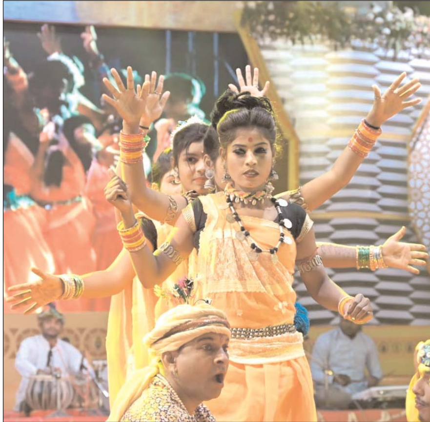
राजिम। राजिम मेला लोक कलाकारों ने नृत्य के जरिए अपनी कला का प्रदर्शन किया।

होनी चाहिए। नक्सल घटना के दौरान डॉ. रमन सिंह की सरकार थी। रमन सरकार में मंत्री रहे सदस्यों से पूछताछ होनी चाहिए। अजय चंद्रकार को कुछ पता है तो उन्हें जांच आयोग के पास जाना चाहिए। जांच आयोग का कार्यकाल बढ़ा तो भाजपा इतना तिलमिला क्यों रही है?।