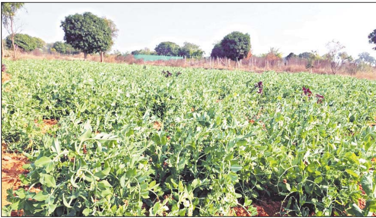
कि समूह के गटन से वे गौतन में विभिन्न गतिविधियों से जुड़कर कार्य कर रही हैं। उन्होंने

बताया कि वर्तमान में समूह में 10 सदस्य हैं, जिनमें से 03 महिला सदस्यों के द्वारा बाड़ी