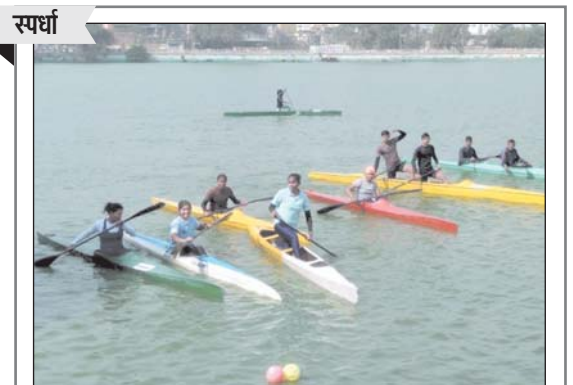
रायपुर। महंत लक्ष्मीनारायण दास महाविद्यालय द्वारा अंतरमहाविद्यालयीन कवायकिंग एवं कैनोइंग प्रतियोगिता का आयोजन बूढ़ातालबा में किया जा रहा है।

प्रक्रिया प्रभावित हो रही है। राजधानी से लगे अमलेश्वर में जमीन की कीमतें भी आसमान छू रही हैं। इसलिए बिल्डर अपने समर्थकों को चुनाव लड़ने का प्रयास कर रहे हैं।