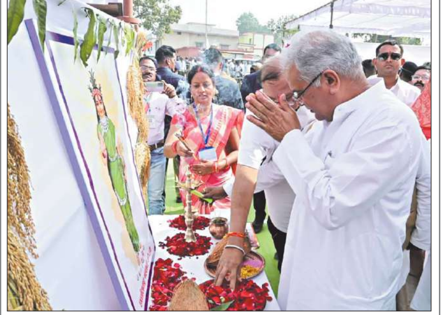
रायपुर। मुख्यमंत्री ने गरियाबंद जिले के गांव छुरा में छत्तीसगढ़ महतारी की पूजा-अर्चना एवं राज्य गीत के साथ भेंट-मुलाकात कार्यक्रम को शुरुआत की।