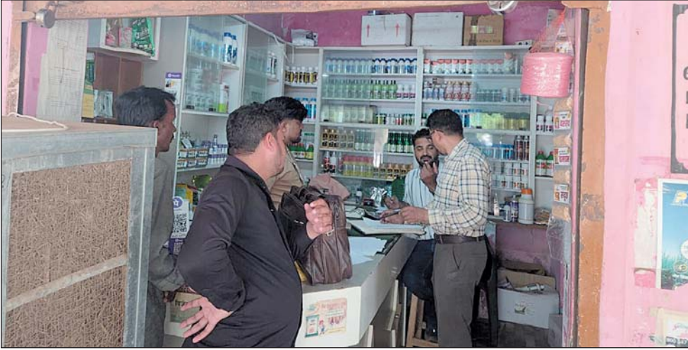
नित्या कृषि केन्द्र एवं रत्ना कृषि केन्द्र के जांच के दौरान कीटनाशी अधिनियम के नहीं किए जाने