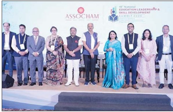
जाने-माने वाणिज्यिक संगठन एसोचैम द्वारा बाद समारोह को संबोधित कर रहे थे। उन्होंने

रायपुर, 10 जुलाई। सांसद और छत्तीसगढ़ भाजपा के वरिष्ठ नेता बृजमोहन अग्रवाल ने कहा कि मोदी सरकार की नई शिक्षा नीति नए तरीके से देश के नव निहल्लों को नवनिर्माण की नित नई राह दिखाएगी। बृजमोहन अग्रवाल बृहस्पतिवार को देश के