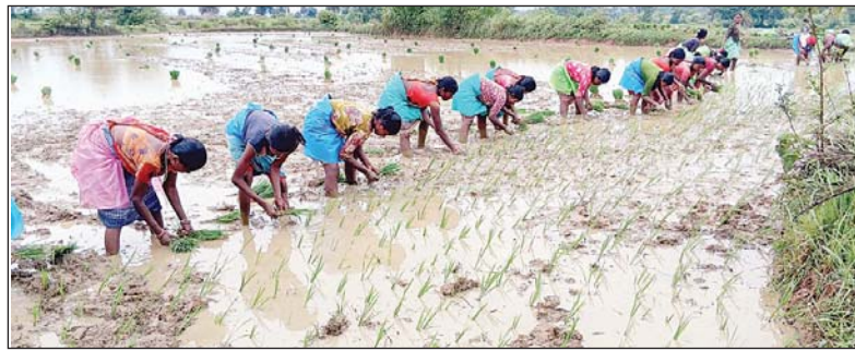
से किसानों को खेती की तैयारियों में बड़ी राहत मिली है और खरीफ फसलों की बुवाई को नई गति मिली है।

रायगढ़, 9 जुलाई। मुख्यमंत्री श्री विष्णु देव साय के नेतृत्व में राज्य सरकार किसानों को खेती-किसानी के लिए हरसंभव सहयोग प्रदान करते हुए खेती को अधिक लाभकारी और सशक्त बनाने की दिशा में लगातार कार्य कर रही है। खरीफ सीजन की शुरुआत में किसानों को आर्थिक संसाधनों की कमी का सामना न करना पड़े, इसके लिए कृषि आदानों की समय पर उपलब्धता सुनिश्चित की गई है। इसी क्रम में रायगढ़ जिले के 33,017 किसानों को 79 प्राथमिक कृषि साख समितियों के माध्यम से 82.19 करोड़ रुपए की अग्रिम कृषि सहायता उपलब्ध कराई गई है। वहीं किसानों को 31.28 करोड़ रुपए मूल्य के खाद एवं बीज उपलब्ध कराए गए हैं। इस प्रकार जिले के किसानों तक अब तक 113.47 करोड़ रुपए की अग्रिम सहायता पहुंचाई जा चुकी है। समय पर मिली इस सहायता