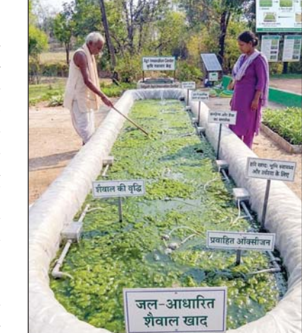
खाद का रूप ले लेती है, जिससे मिट्टी में नाइट्रोजन, कार्बनिक पदार्थ तथा अन्य आवश्यक पोषक तत्वों

रायगढ़, 9 जुलाई। कृषि की बढ़ती लागत और मृदा की घटती उर्वरता के बीच हरी खाद किसानों के लिए एक प्रभावी, प्राकृतिक और किफायती विकल्प बनकर उभर रही है। कृषि महाविद्यालय एवं अनुसंधान केन्द्र, रायगढ़ के प्राध्यापकों एवं वैज्ञानिकों ने किसानों से हरी खाद एवं हरी पत्तियों की खाद का अधिकाधिक उपयोग करने की अपील करते हुए बताया कि इससे मिट्टी की उर्वरक क्षमता बढ़ती है, रासायनिक उर्वरकों पर निर्भरता घटती है तथा फसलों की उत्पादकता और गुणवत्ता में उल्लेखनीय सुधार होता है। वैज्ञानिकों ने बताया कि हरी खाद के लिए ढ़ैंचा, सनाई, मूंग, उड़द, लोबिया एवं ग्वार जैसी दलहनी फसलें बोई जाती हैं। इन फसलों को बुवाई के लगभग 35 से 45 दिन बाद, फूल आने से पहले रोटावेटर अथवा कल्टीवेटर की सहायता से खेत में ही मिट्टी में मिला दिया जाता है। कुछ दिनों में यह सड़कर जैविक