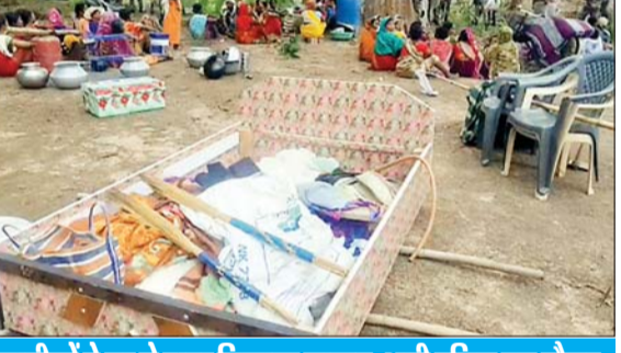
ग्रामीणों ने घर से बाहर निकाला सामान, भारी पुलिस बल मौजूद

नारायणपुर, 30 जून। जिले में भरपूर का बाढ़ खड़का गांव में धर्मांतरण को लेकर विवाद शुरू हो गया है। धर्मांतरित परिवारों को गांव छोड़ने का फरमान जारी किया गया है। आदिवासी सामाजिक के लोगों ने धर्मांतरित परिवारों के घरों से सामानों को बाहर निकाल दिया है। इसके बाद इलाके में तनावपूर्ण स्थिति को देखते हुए भारी पुलिस बल तैनात किया गया है। दरअसल, पूरा मामला खड़का गांव का है। जहां आदिवासी समुदाय और धर्मांतरित परिवारों के बीच भारी विवाद की स्थिति बनी हुई है।