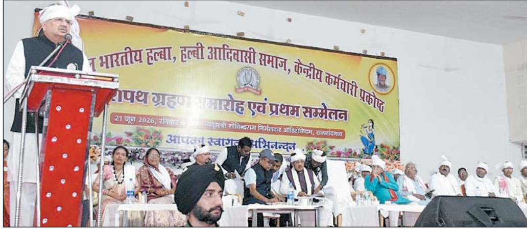
आवाज बनकर कार्य कर रहा है।

राजनांदगांव 22 जून। विधानसभा अध्यक्ष डॉ. रमन सिंह आज राजनांदगांव स्थित पद्मश्री गोविंदराम निर्मलकर आडिटीरियम में आयोजित अखिल भारतीय हल्बा-हल्बी आदिवासी समाज केन्द्रीय कर्मचारी प्रकोष्ठ के नवनिर्वाचित पदाधिकारियों के शपथ ग्रहण समारोह सह प्रथम सम्मेलन कार्यक्रम में शामिल हुए। विधानसभा अध्यक्ष डॉ. सिंह की उपस्थिति में नव निर्वाचित पदाधिकारियों को बधाई एवं शुभकामनाएं दीं। उन्होंने हल्बा समाज की मांग पर राजनांदगांव के वार्ड क्रमांक 22 रेवाडीह में समाज के लिए उपलब्ध भूमि पर सामुदायिक भवन निर्माण हेतु 10 लाख रूपए प्रदान करने की घोषणा की। विधानसभा अध्यक्ष डॉ. सिंह ने कहा कि यह कार्यक्रम समाज की समृद्ध संस्कृति, परंपरा और सामाजिक चेतना की नवजागरण का उत्सव है। विधानसभा अध्यक्ष डॉ. सिंह ने कहा कि हल्बा समाज छत्तीसगढ़ के सबसे संगठित और जागरूक आदिवासी समुदायों में से एक है, जिसकी पहचान केवल छत्तीसगढ़ तक सीमित नहीं है, बल्कि महाराष्ट्र, मध्यप्रदेश और ओडिशा सहित अन्य राज्यों में भी समाज के लोग आदिवासी समाज के सम्मान, अधिकार महत्वपूर्ण योगदान दे रहे हैं। उन्होंने कहा कि समाज की राष्ट्रीय महासभा की संगठनात्मक संरचना की सराहना की। यह संगठन आदिवासी समाज की सशक्त