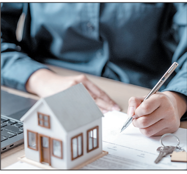
15 दिन पहले प्रकाशित करनी होगी। इतना ही नहीं नए नियम के मुताबिक 50 करोड़ रुपये से अधिक मूल्य की संपत्ति के लिए

रायपुर 17 जून। छत्तीसगढ़ में अचल संपत्तियों की खरीद और बिक्री के नियमों में बदलाव किया गया है। अब से नगरीय निकायों की जमीन, दुकान, भवन और अन्य अचल संपत्तियों को खरीदने के लिए नए नियमों का पालन करना होगा क्योंकि राज्य शासन ने छत्तीसगढ़ नगरपालिका (अचल संपत्ति व्यवस्थापन) नियम, 2026 लागू कर दिया।