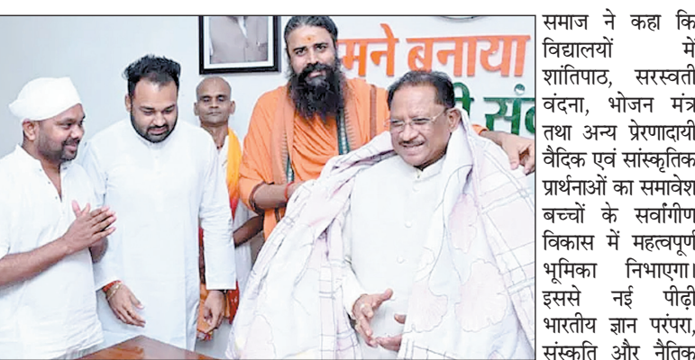
का विकास होता था। समय के साथ ये परंपराएं शैक्षणिक वातावरण से धीरे-धीरे विलुप्त होती गईं, किंतु अब राज्य सरकार द्वारा इन्हें पुनः स्थापित करने की पहल अत्यंत स्वागतयोग्य है। संत मूल्यों से जुड़ सकेंगे। मुख्यमंत्री श्री विष्णु देव साय ने कहा कि शिक्षा केवल ज्ञान अर्जित करने का माध्यम नहीं, बल्कि संस्कार, चरित्र निर्माण और जीवन मूल्यों