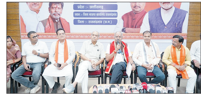
नहीं रही, बल्कि उनका लाभ सीधे लोगों तक पहुंचा। यही कारण है कि आज देश का प्रत्येक नागरिक सरकार की योजनाओं को अपने जीवन में महसूस कर रहा है।

उन्होंने कहा कि प्रधानमंत्री नरेन्द्र मोदी स्वतंत्र भारत के इतिहास में सबसे लंबे समय तक लगातार सेवा देने वाले प्रधानमंत्री बने हैं। 10 जून को उनके नेतृत्व के 12 वर्ष पूर्ण हुए हैं। इस दौरान देश में सुशासन, पारदर्शिता और सेवा भाव पर आधारित शासन व्यवस्था स्थापित हुई है, जिसके कारण जनता का विश्वास लगातार बढ़ा है। बृजमोहन अग्रवाल ने कहा कि मोदी सरकार ने पहली बार योजनाओं को जाति, वर्ग और वोट बैंक की राशनीति से ऊपर उठाकर महिलाओं, युवाओं, किसानों और गरीबों के कल्याण पर केंद्रित किया। योजनाएं केवल कागजों तक सीमित