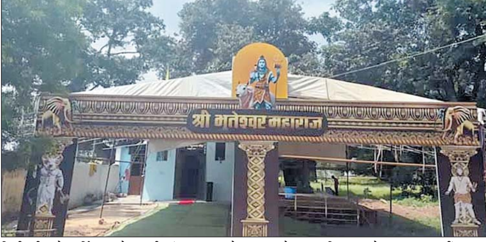
किसी भी बड़े धार्मिक आयोजन की मंगल शुरुआत का प्रतीक माना जाता है। इसके बाद 8 जून को प्रातः 6 बजे काया शुद्धि का आयोजन होगा, जिसमें आध्यात्मिक शुद्धि और धार्मिक भगवान विष्णु की

जगदलपुर, 4 जून। बस्तर जिला मुख्यालय के निगम क्षेत्र अंतर्गत प्रवीर वार्ड पनारा पारा स्थित श्रीभूवेश्वर महादेव मंदिर एवं श्रीलक्ष्मी नारायण मंदिर परिसर में हरिहर महायज्ञ का आयोजन किया जा रहा है। पुरुषोत्तम मास (अधिक ज्येष्ठ शुक्ल पक्ष) के पावन अवसर पर आयोजित होने वाले इस धार्मिक आयोजन में नौ दिनों तक वैदिक अनुष्ठान, पूजन, अर्चन, भजन-कीर्तन और धार्मिक कार्यक्रमों की श्रृंखला चलेगी। आयोजन समिति ने श्रद्धालुओं से अधिक से अधिक संख्या में सनानी वेशशुभ्रा में शामिल होकर धर्म और संस्कृति के इस महोत्सव का हिस्सा बनने की अपील की है। महायज्ञ की शुरुआत 5 जून को पंचमी तिथि पर शाम 6 बजे अंकुरारोपण के साथ होगी। वैदिक परंपरा के अनुसार यह अनुष्ठान