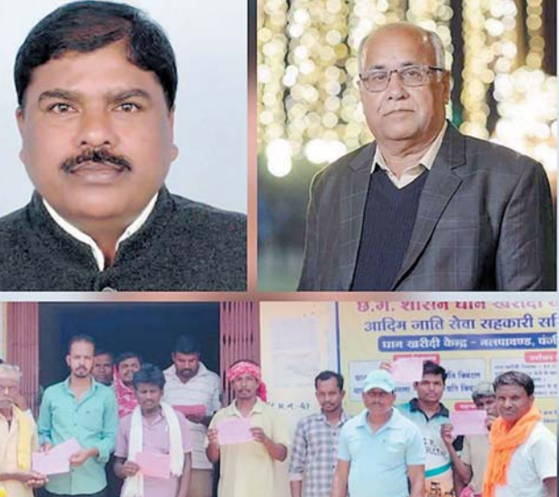
डीएपी की शेष मात्रा के लिए नैनो डीएपी एवं अन्य वैकल्पिक उर्वरकों का उपयोग किया जाएगा। शासन का उद्देश्य संतुलित उर्वरक उपयोग को बढ़ावा देना, खेती की लागत कम करना तथा मृदा की उर्वरा शक्ति का संरक्षण करना है।