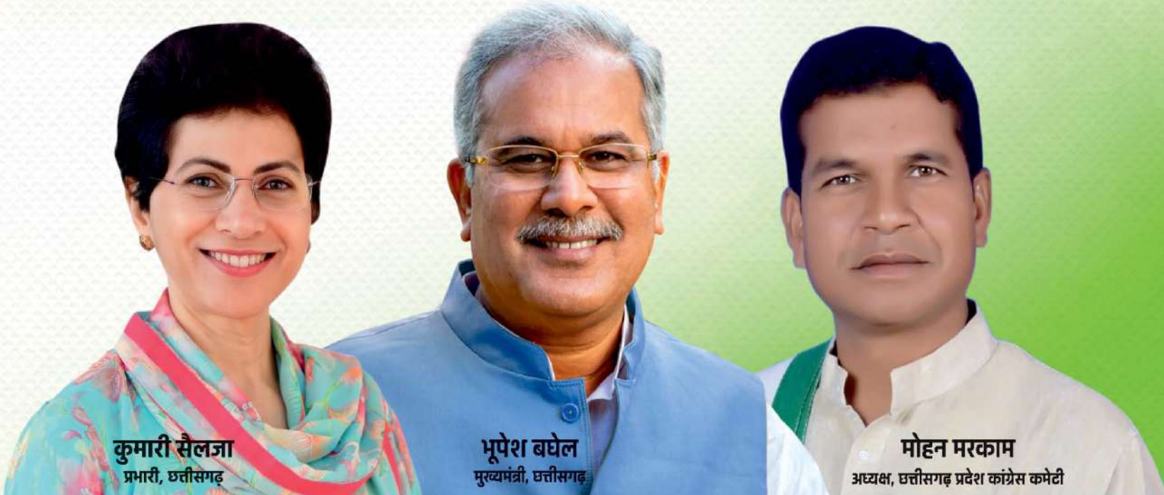
कुमारी सैलजा प्रभारी, छत्तीसगढ़